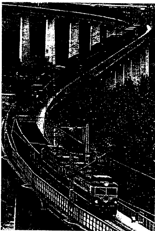
七年過去，RDS-2提出的六條鐵路線，貨運專線無限期擱置。

特首曾蔭權日前宣布港府決定廣深港鐵路香港段，採用專用路軌方案建造。大部分傳媒都以頭條報道，興奮莫名。