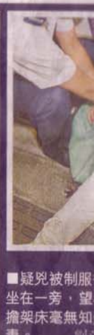
疑兇被制服坐在一旁，望擔架床毫無知妻。