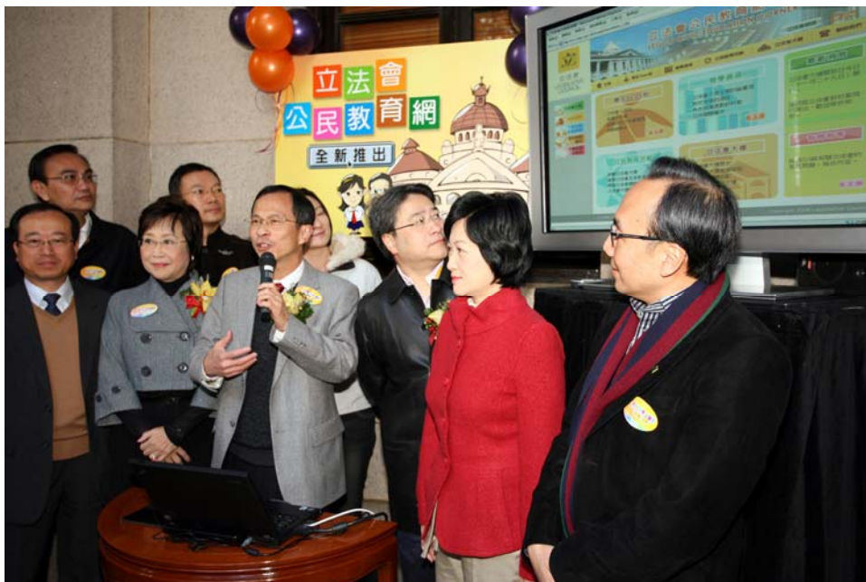
立法會主席曾鈺成（左五）向來賓簡介「立法會公民教育網」的特色。