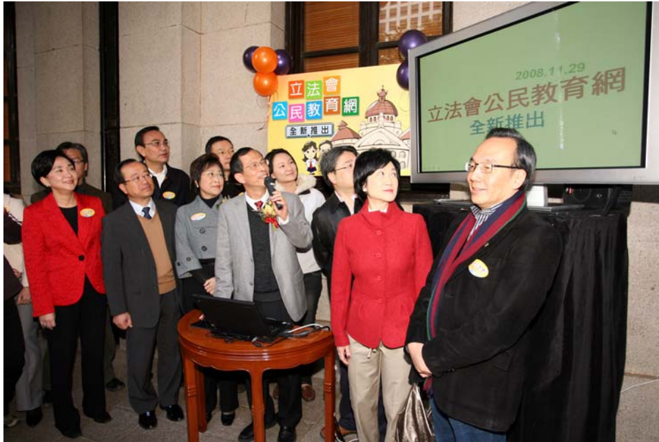
立法會主席曾鈺成（右五）今日（十一月二十九日）於立法會大樓開會日活動上，主持全新推出的「立法會公民教育網」的啓用儀式。其他出席儀式的立法會議員包括（由左起）劉慧卿、黃成智、陳鑑林、劉秀成、立法會內務委員會主席劉健儀、謝偉俊、李慧琼、立法會內務委員會副主席李華明、葉劉淑儀及梁家傑。