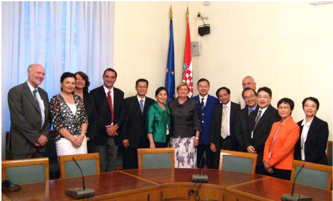
代表團與克羅地亞國會多個政黨的代表及核心小組的首長會晤。