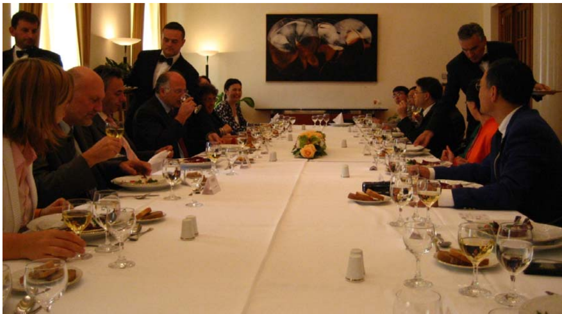
代表團出席克羅地亞與中國成立的跨議會友好組織舉辦的工作午餐會。