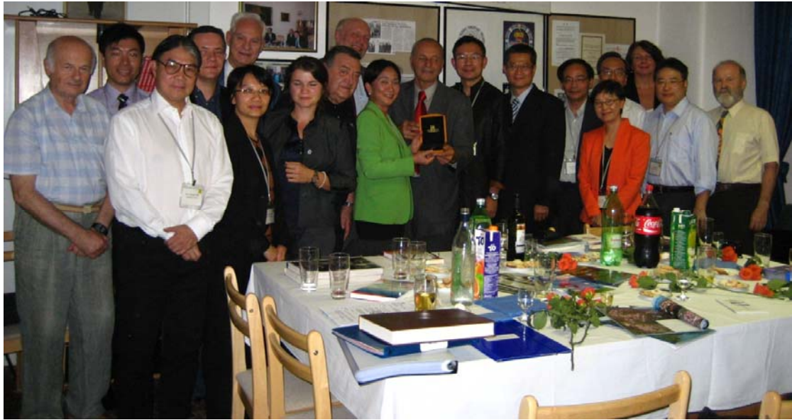
代表團與克羅地亞——中國友好協會(非政府機構)會晤。