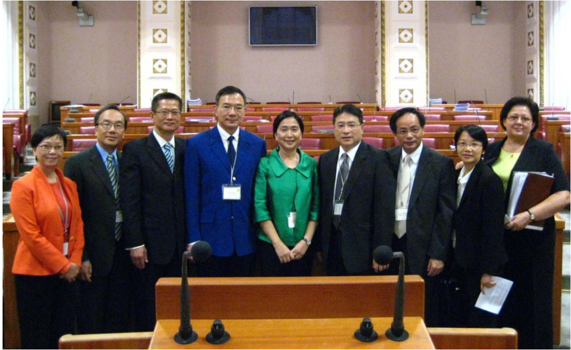
代表團參觀克羅地亞國會會議廳。