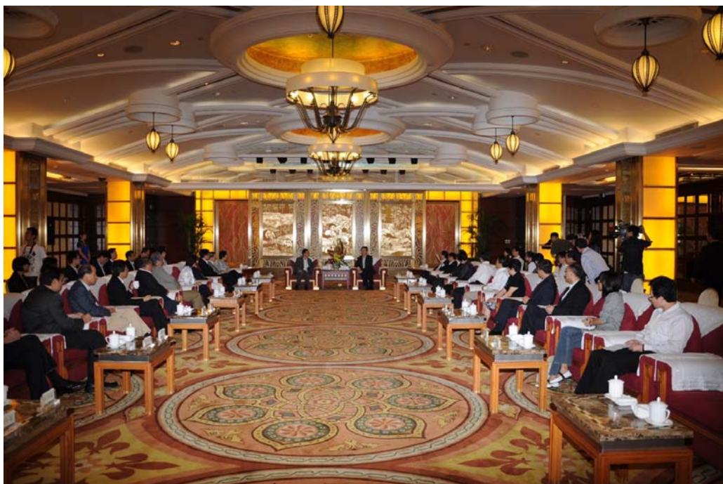
立法會議員與四川省常務副省長魏宏會面。