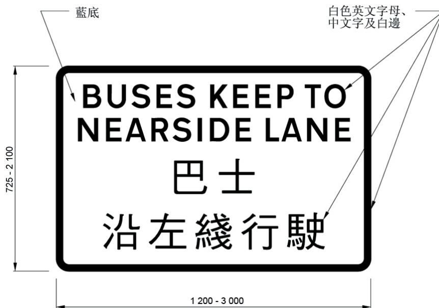
在隧道內沿左邊行車綫行駛