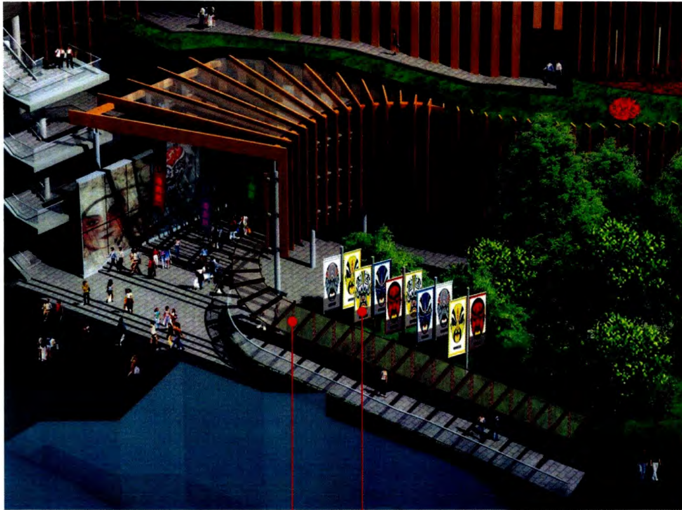
沿入口坡道 增設遮蓋 Addition of cover along entrance ramp