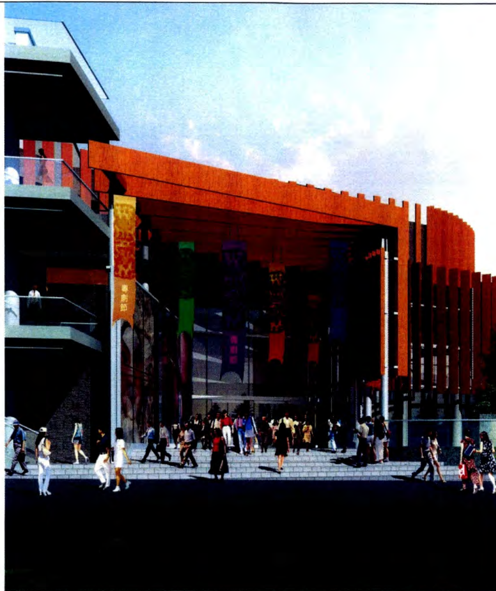
MAIN ENTRANCE OF THE ANNEX BUILDING (ELEVATION) 高山劇場新翼正門入口立面圖

59RE CONSTRUCTION OF AN ANNEX BUILDING AT THE KO SHAN THEATRE 高山劇場興建新翼大樓工程計劃