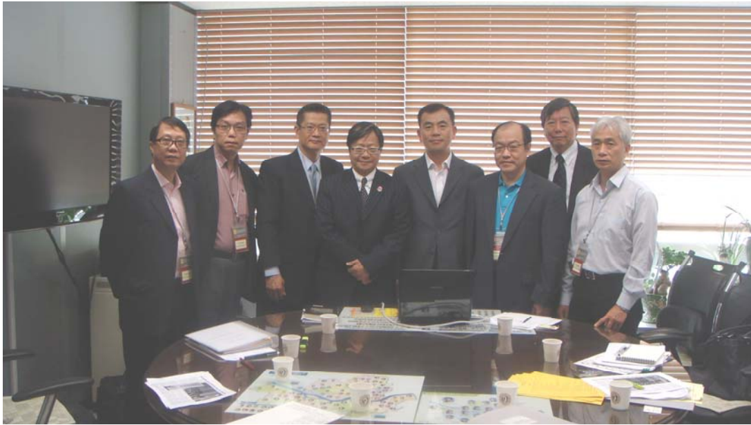
與首爾市政府會晤，瞭解在當地推行的減貧措施