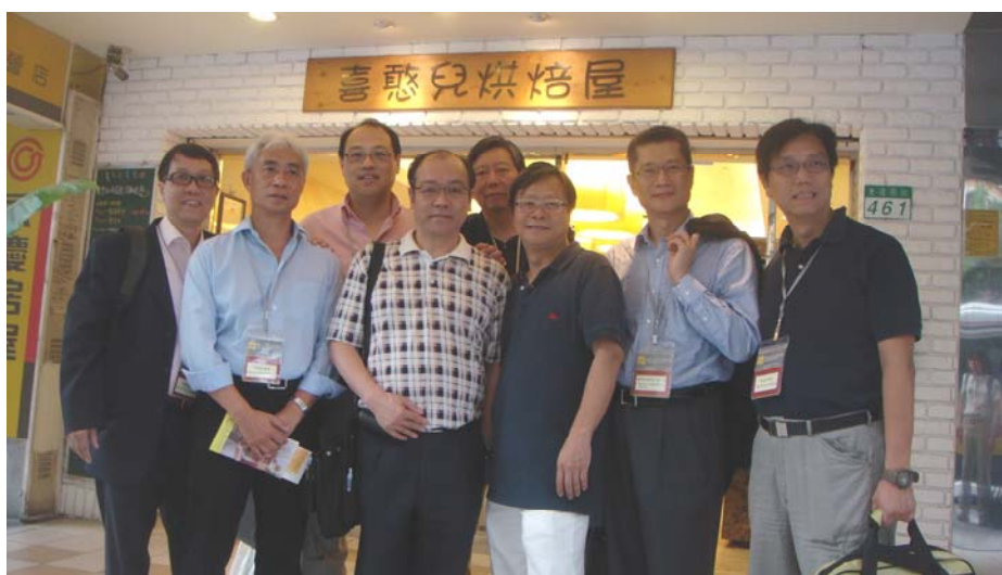
參觀喜憨兒社會福利基金會經營的烘焙屋

2.62 訪問團參觀喜憨兒基金會營辦的一間烘焙屋，並於該會經營的一間餐廳午膳。訪問團獲悉，產品和服務質素是業務成功的關鍵。