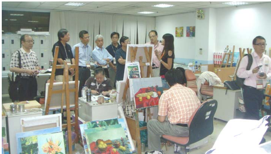
參觀伊甸福利基金會開辦的技能訓練班

2.42 訪問團察悉，伊甸基金會50%的營運費用由政府資助，其餘由捐款(30%)和業務收益(20%)支付。