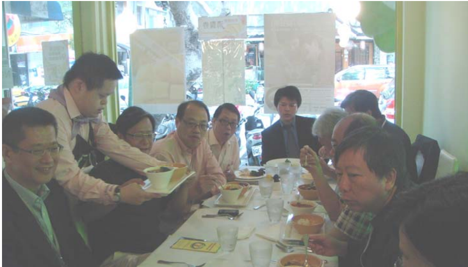
在喜憨兒社會福利基金會經營的餐廳午餐