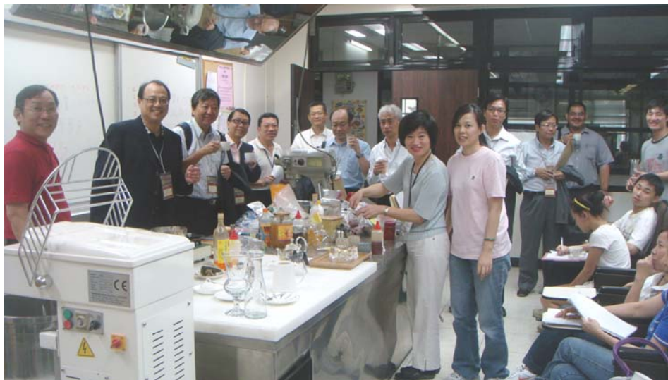
參觀台北職業訓練中心的烹飪班

2.26 訪問團察悉，因近期發生金融海嘯，失業人士可修讀為期較長的課程以接受更深入的技能訓練，或同時修讀超過一個課程以紓緩求職壓力。他們可領取額外的職業訓練生活津貼。