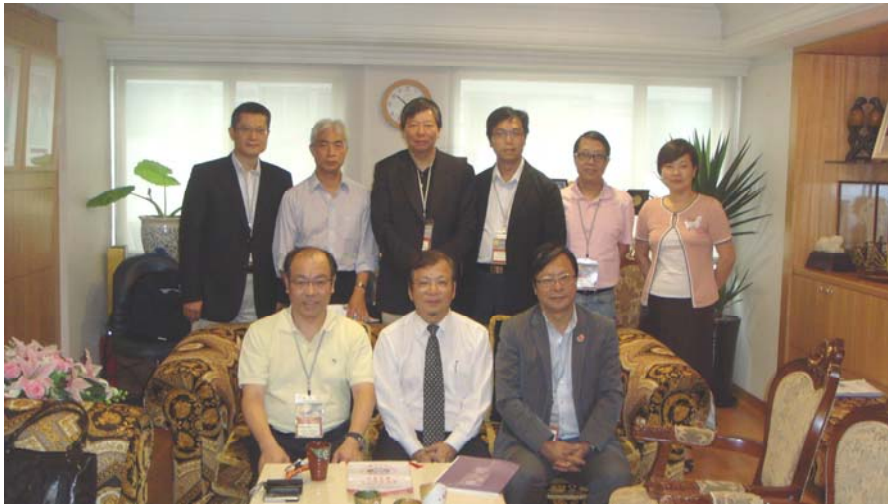
訪問中華民國中小企業協會

2.58 訪問團察悉，職訓局為促使各項計劃成功推行，在2009年聯同中小企業協會和捷安特股份有限公司推出"多元就業單車遊"，鼓勵民眾騎單車前往台北、基隆、宜蘭和花蓮，到訪參與多元就業開發方案的企業。參加者獲發單車護照。若他們到訪5家企業或撰寫一篇有關其中一家企業的日記，便有機會獲贈獎品。這項活動提供平台，讓公眾更瞭解參與機構所製造的產品及提供的服務，亦可推動當地經濟活動。