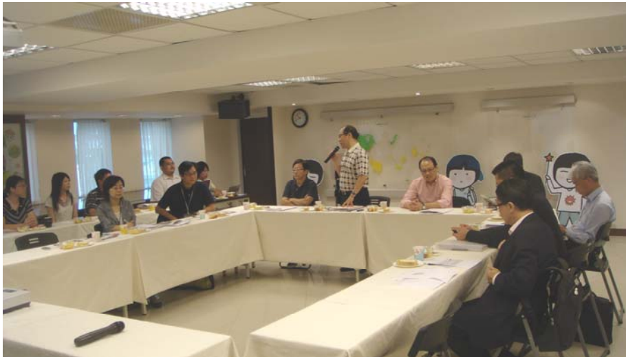
台灣兒童暨家庭扶助基金會簡介其工作

2.38 訪問團察悉，家扶基金會進行一項試驗計劃，向15個經選定的家庭提供財政管理意見，目的是協助這些家庭設定為期一年的儲蓄計劃及目標。這些家庭會獲得等額供款。儲蓄款項由家扶基金會保管，只可用作達致儲蓄的目標。關於儲蓄計劃的成功率，家扶基金會表示，只有40%的參加者達成儲蓄目標，但80%的參加者認為，他們參加計劃後心理上已擺脫貧困。