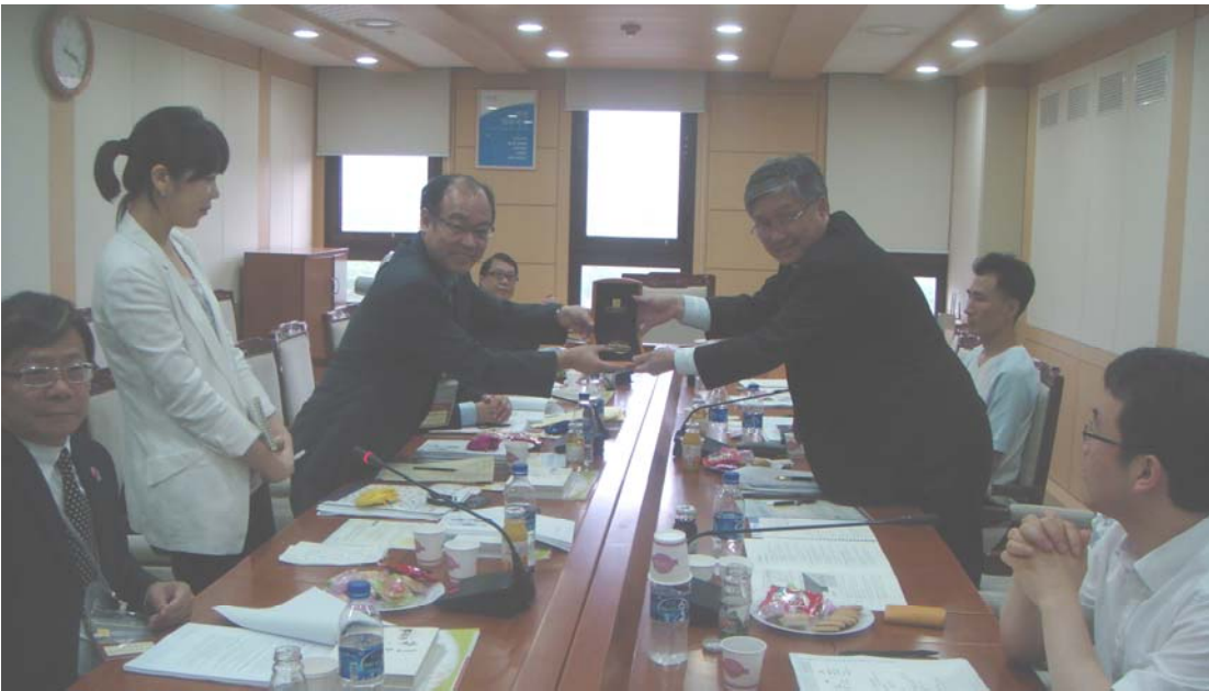
訪問勞動部轄下的社會企業科

3.29 社企的主要角色包括為弱勢社羣提供工作機會，協助他們融入一般勞工市場、為弱勢社羣(例如婦女和長者)創造促進就業的工作機會，以及提供機會，讓那些計劃經營創新業務的年青人、婦女及退休技術工人在新興市場創業。