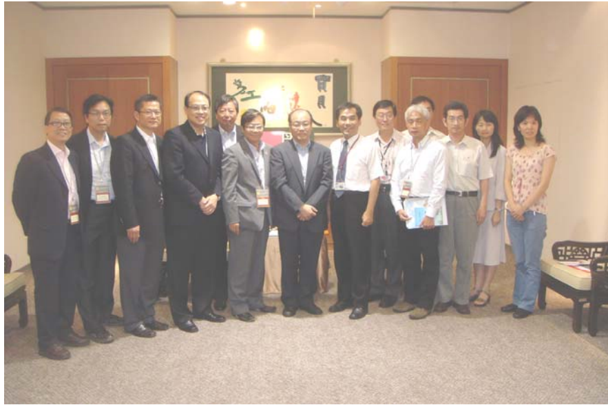
與勞工委員會官員會面

2.17 據勞委會表示，台灣政府採取三管齊下的方式(即失業保險、職業訓練和就業服務)，建立完善的就業保障制度及處理失業問題。勞工保險局(下稱"勞保局")和職業訓練局(下稱"職訓局")負責執行有關工作。