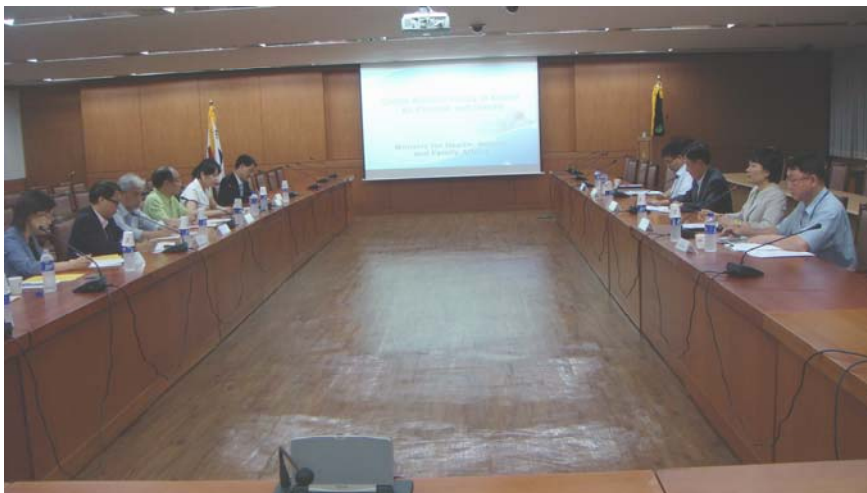
衛生福利家庭部簡介其工作

3.9 衛生福利家庭部根據2006年9月制訂的擴大社會服務框架計劃(Framework Plan to Expand Social Services)，在2007年確立推行策略，因應當地居民的需求擴大社會服務範圍、創造使用者為本的市場，以及引入電子代用券，令市場有效運作及具透明度。為配合上述策略，衛生福利家庭部全力為建立市場而進行各項準備工作，包括發展新的社會服務、藉提供代用券刺激需求，以及協助理順服務流程。最重要的是，當局大幅增加投資，在醫療及福利界別創造社會服務職位。在2006年，衛生福利家庭部投資了1,135億南韓圓(6億9,000萬港元)，創造15 000個職位。到2009年，投資額更上升至7,563億南韓圓(45億8,000萬港元)，創造的職位達147 000個。衛生福利家庭部指出，政府的財務資源只用作催化市場的初期發展。當局打好基礎，透過競爭和讓使用者作出選擇以提供社會服務。