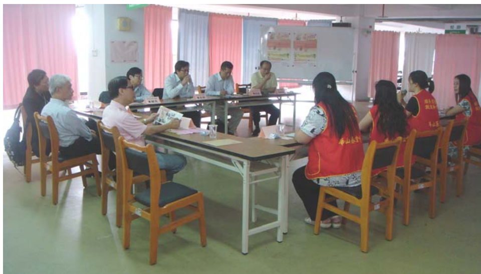
華山社會福利慈善事業基金會(長者福利)簡介其工作

2.44 基金會的職員向訪問團指出，在台灣，長者公共開支總額中，90%用作發放老年年金，而非用作提供長者服務。基金會不是受資助的福利機構，但由於社會人士對長者服務需求殷切，因此基金會獲得的捐款足以維持該會的運作。由於該會自負盈虧，可享有較大彈性推行新的服務模式，不受政府規管。例如，基金會推行長者共住模式，安排4名長者共住於同一單位。這安排讓長者在使用老年年金及身心殘障年金時可享有更多選擇，揀選最切合他們需要的護理服務。