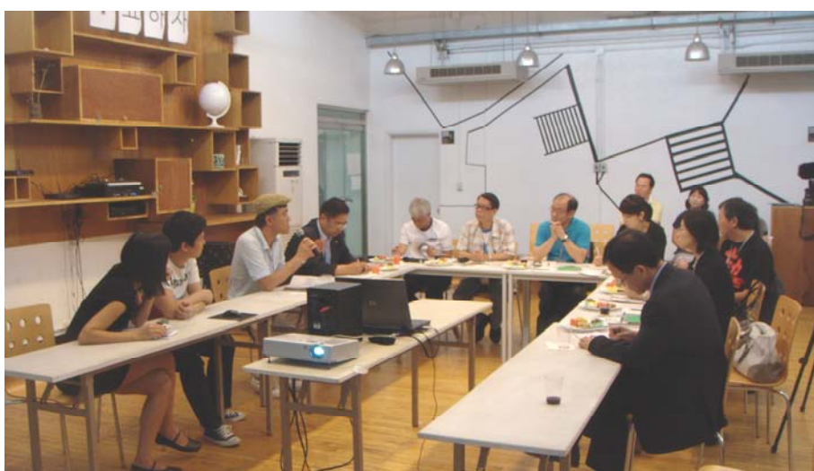
遊戲團講解其工作和活動

3.50 Haja中心和遊戲團的員工向代表團指出，自從1990年代末發生亞洲金融危機後，南韓的年輕一代便一直生活在一個經濟低增長而失業率高企的社會中，面對着種種風險。更重要的是，終身聘用的概念已經徹底改變。Haja中心為難以適應傳統教育的青少年提供另類學習形式，從而培養他們的創意和藝術才能。該中心營辦多項青少年計劃。訪問團察悉，遊戲團的創意備受賞識，因而有機會出席多個商業宣傳節目。舉例來說，遊戲團曾獲首爾市政府贊助，參與香港2009年