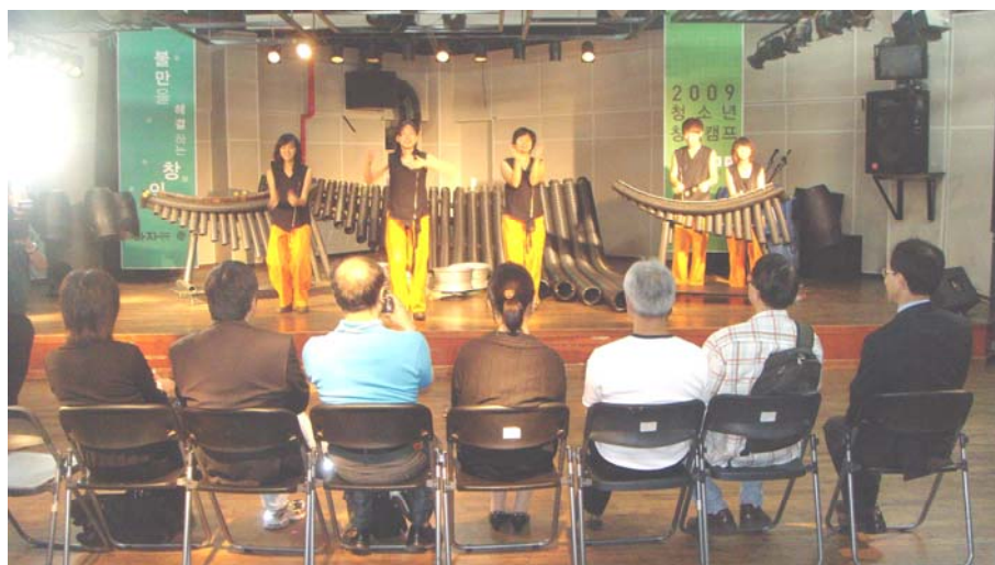
遊戲團的創新表演

產品讚嘆不已。訪問團並到訪另一家社企 —— Yori會。該會由青少年及已婚移民婦女主理，在Haja中心提供餐飲服務。