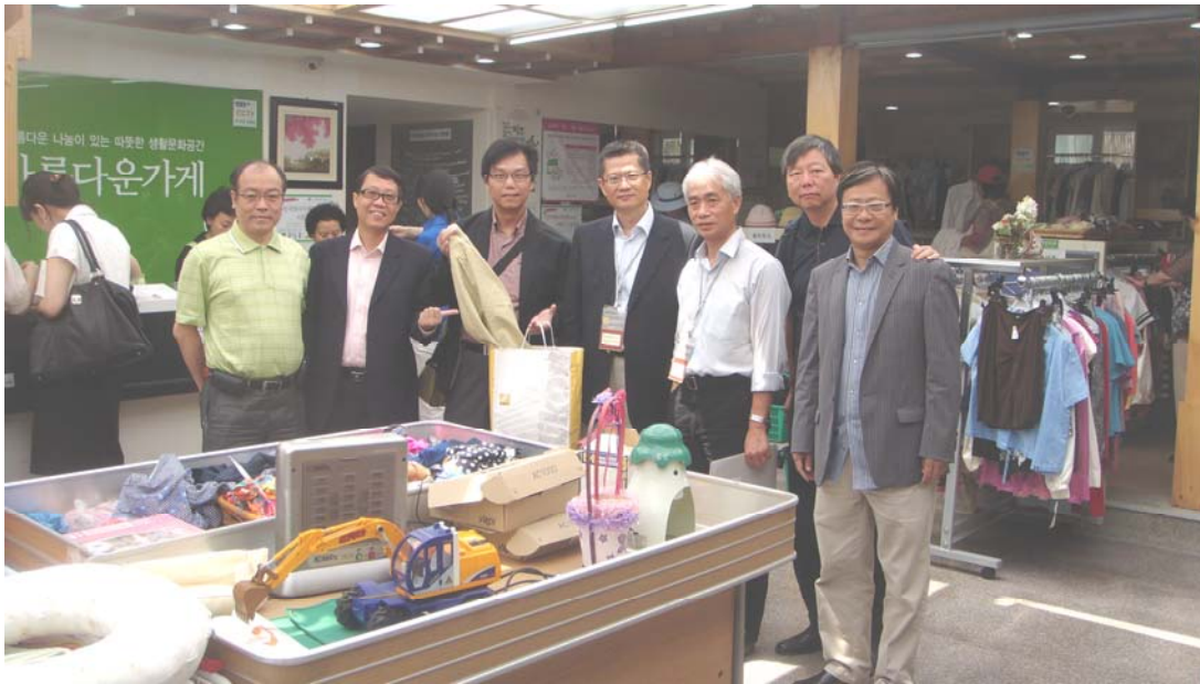
參觀美麗商店轄下一間連鎖店鋪

3.47 美麗商店的員工告知訪問團，除了像其他社企般接受政府的僱員薪酬資助外，該商店的營運基本上與其他私營公司無異。成功的關鍵在於營運模式，即店鋪的設計和貨品陳列方式均類似附近的其他零售商店。美麗商店亦歡迎義工參與，他們的義工人數大約多達7 000名，當中包括家庭主婦和學生。義工可協助推廣美麗商店，爭取社區的普遍接納。他們認為，美麗商店的顧客來自各階層，足可證明商店成立時恪守的循環再用和分享的理念能廣泛傳遞。訪問團並注意到，鑒於美麗商店不涉及政治的背景和所秉持的使命，宗教及福利團體都願意提供場地或地方，供美麗商店開設連鎖店鋪。