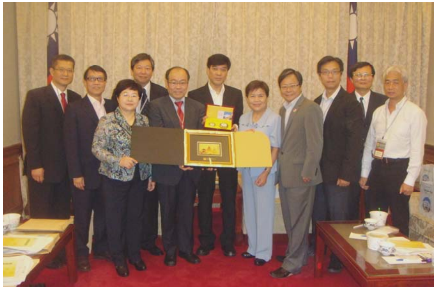
訪問團向立法院社會福利及衛生環境委員會委員致送紀念品

2.3 此外，訪問團與一些學者會晤，彼此就台灣處理貧窮問題的政策和措施的成效交換意見。