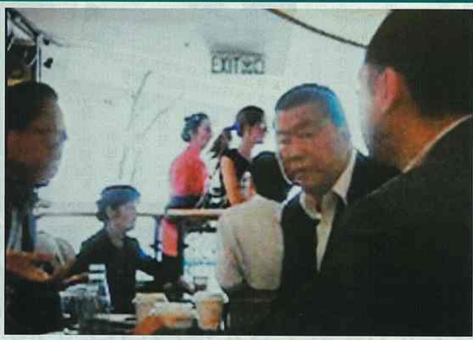
◀ 多年來甘乃威一直博上位，去年更出盡招數爭取立法會選舉，李柱銘心不甘情不願將「火棒」交給甘乃威。