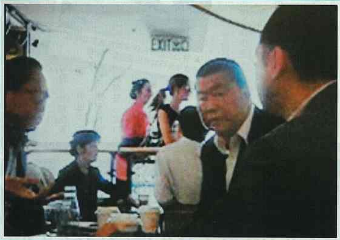
◀ 多年來甘乃威一直博上位，去年更出盡招數爭取立法會選舉，李柱銘心不甘情不願將「火棒」交給甘乃威。