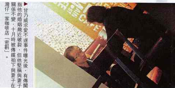
甘乃威求愛不遂事件曝光後，有傳聞指他的婚姻幾近破裂，但他堅稱與妻子關係不變，十月時被傳媒拍下與妻子在灣仔一家咖啡店「密約」。