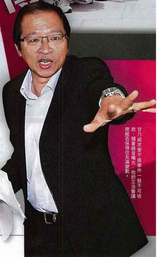
甘乃威求愛不遂事件一發不可收拾，隨着錄音曝光，他的立法會議席能否保得住充滿變數。

的內容相近，主要圍繞王要求甘在以個人名義發道歉信，發出在職證明澄清其工作表現沒有問題，以及向民主黨議員通報事件等。 王又提到想民主黨全體議員公開譴責甘乃威、向黨內辦事處員工通報王麗珠的解僱及工作表現無關等。 錄音無提保密協議 據悉雖然有四人會面，但主要是何俊仁及譚香文在談判，何