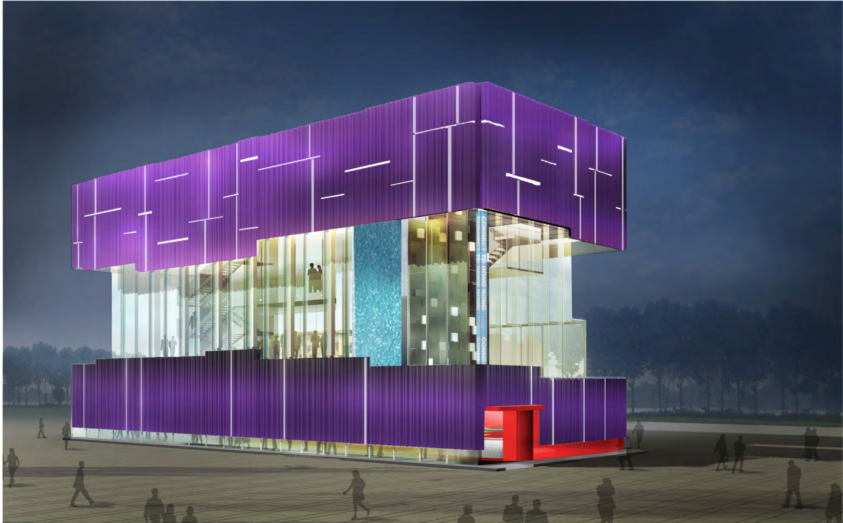
夜景透视 Night View Perspective