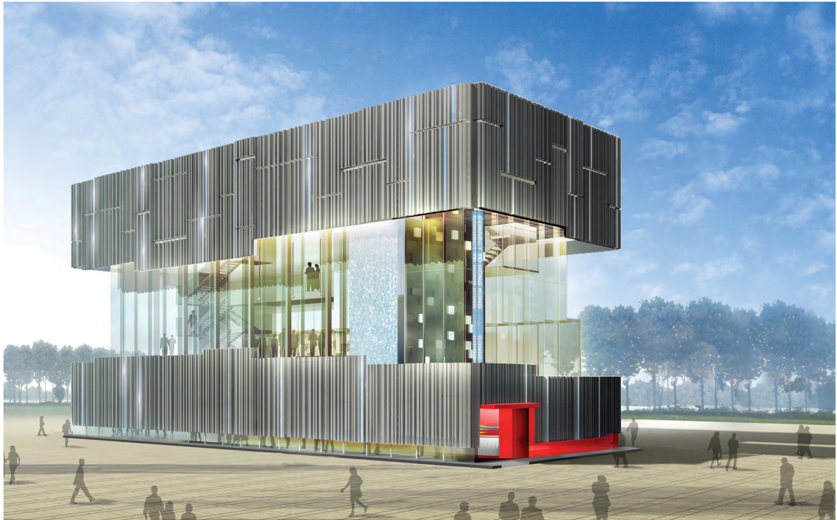
日景透视 Day View Perspective