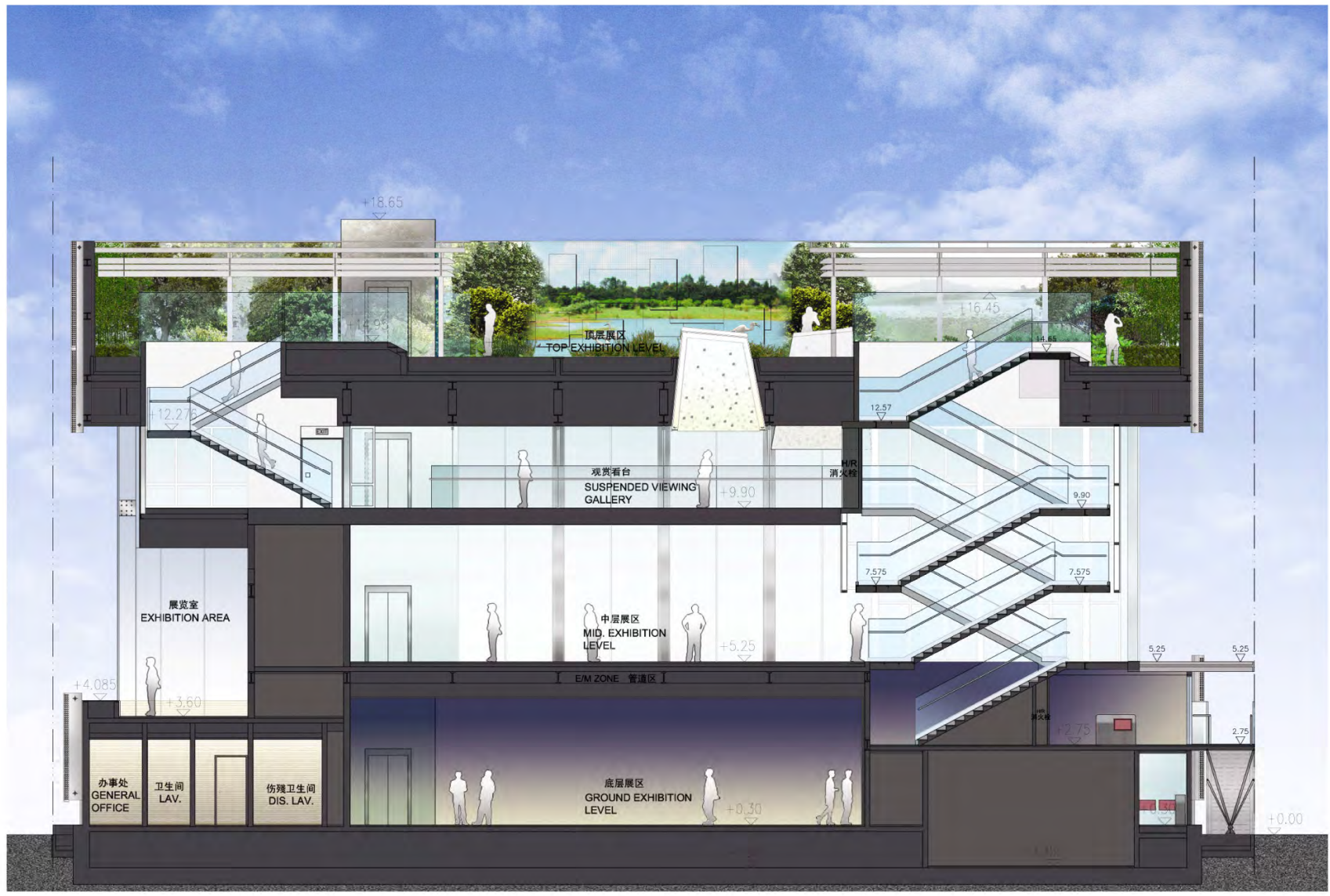
剖面图 Section Elevation