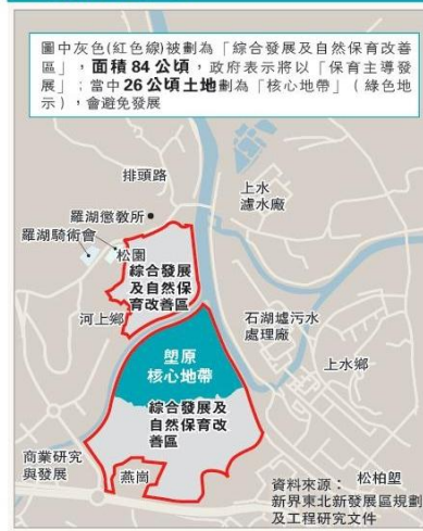
圖中灰色(紅色線)被劃為「綜合發展及自然保育改善區」，面積84公頃；政府表示將以「保育主導發展」；當中26公頃土地劃為「核心地帶」(綠色地帶)，會避免發展