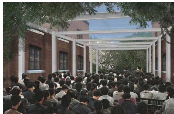
有蓋庭園/戶外表演場地及活動場地