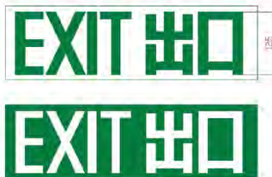
Figure 1 – Current Exit Sign