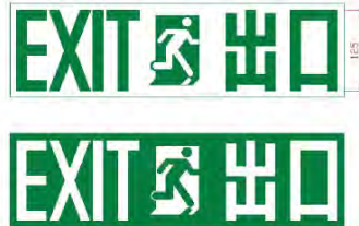
Figure 2 – Combined Graphical Symbol and Characters Exit Sign