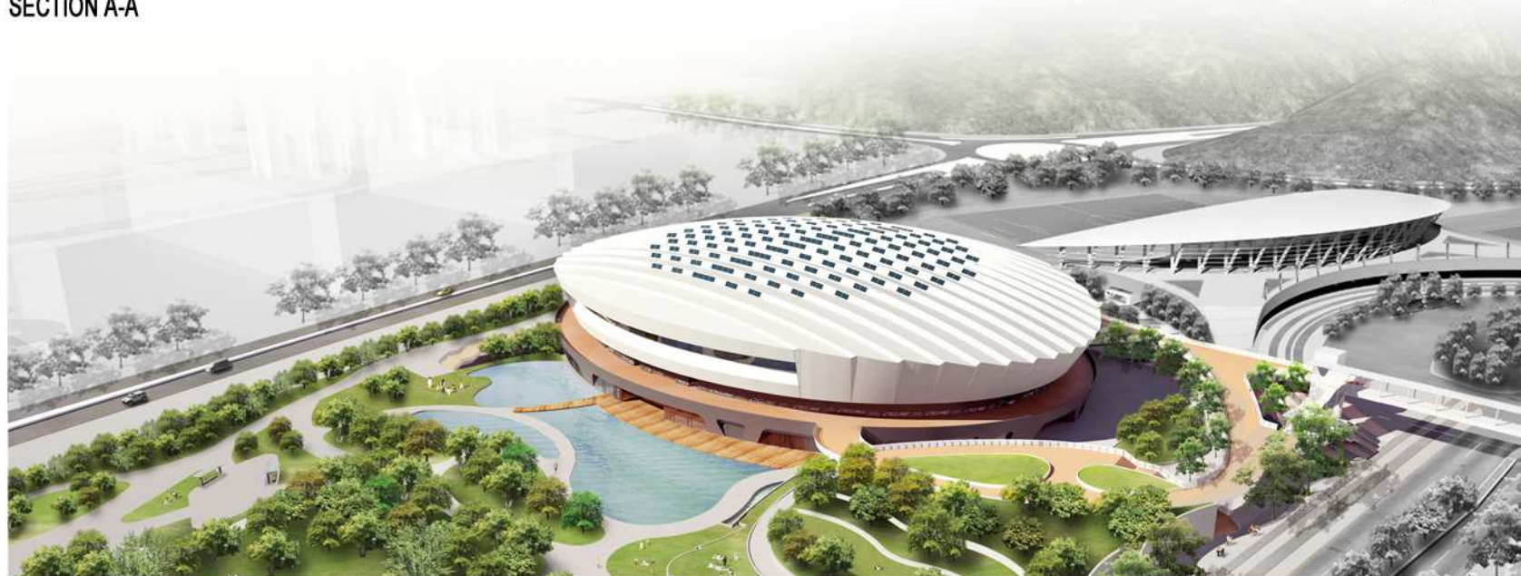
西面鳥瞰圖 AERIAL VIEW FROM WESTERN DIRECTION (ARTIST'S IMPRESSION)

054RG 將軍澳第45區市鎮公園, 室內單車場及體育館 TOWN PARK, INDOOR VELODROME-CUM-SPORTS CENTRE IN AREA 45, TSEUNG KWAN O