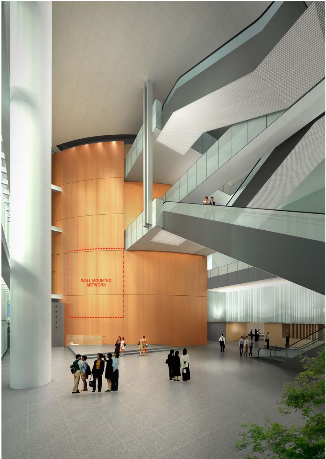
位於議會樓大堂鼓形牆身擺放藝術品的位置。