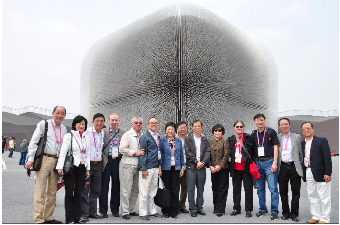
部分訪問團成員在英國館外留影。