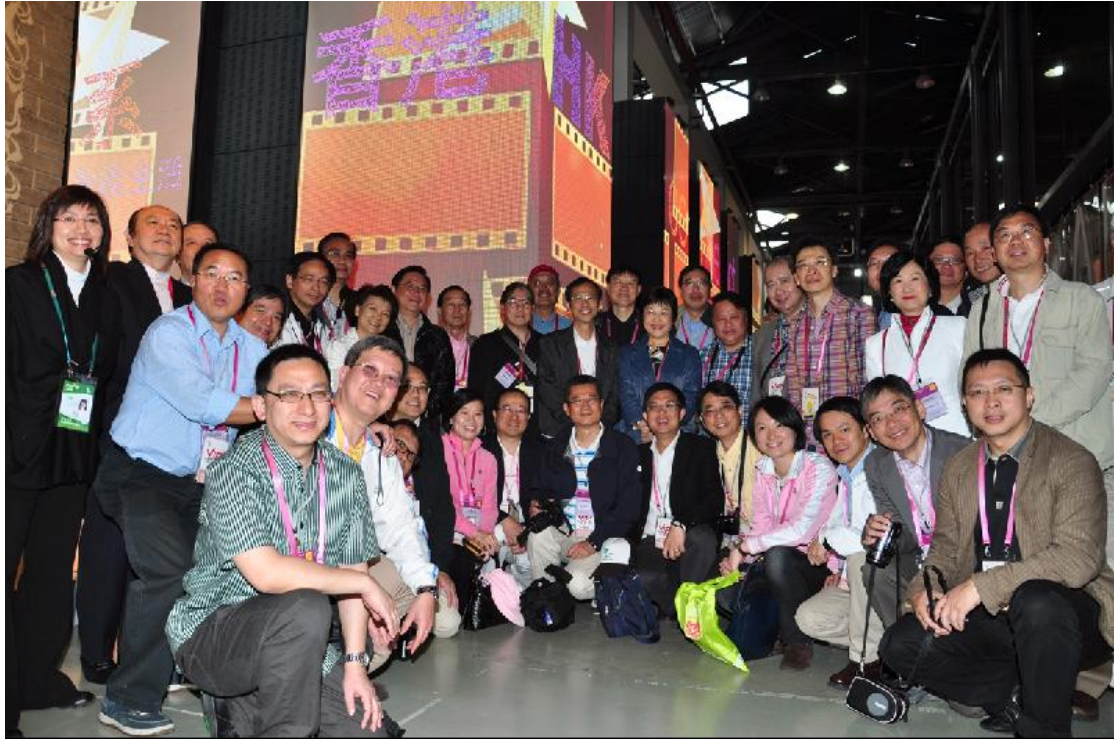
立法會上海世博訪問團於城市最佳實踐區香港案例館內合照留念。