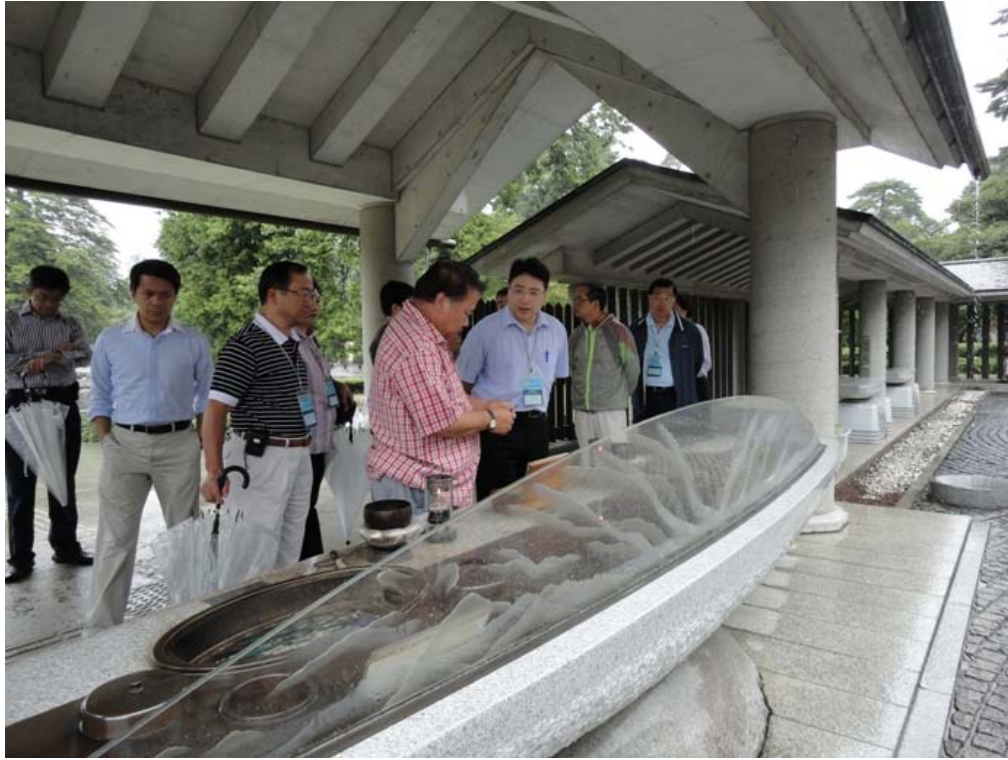
訪問團參觀多磨靈園的設施，以瞭解這個由東京都政府營運的墓園的運作模式。