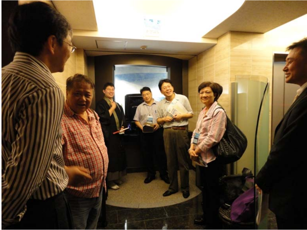
訪問團參觀東京御廟的設施。