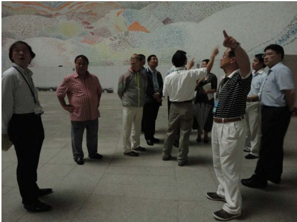
訪問團參觀多磨靈園的設施。