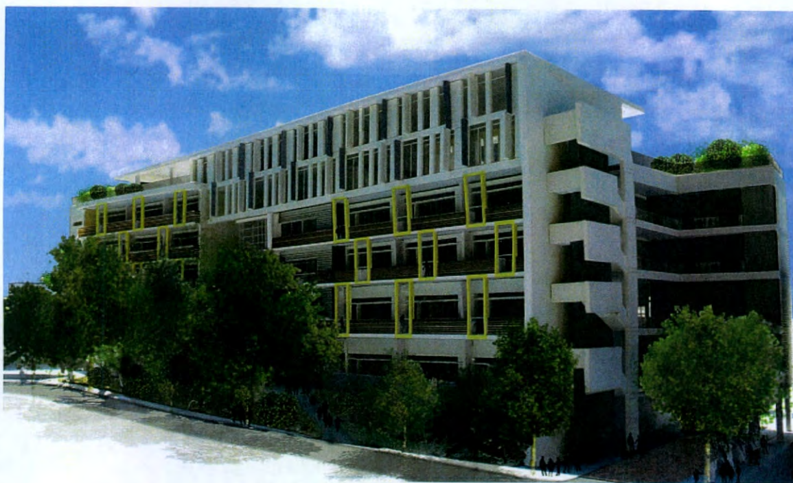
VIEW OF THE NEW SCHOOL PREMISES FROM PERTH STREET 從巴富街望向校舍構思圖