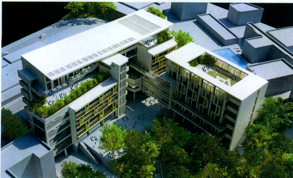
AERIAL VIEW OF THE NEW SCHOOL PREMISES FROM PERTH STREET SPORTS GROUND 從巴富街運動場望向校舍鳥瞰構思圖