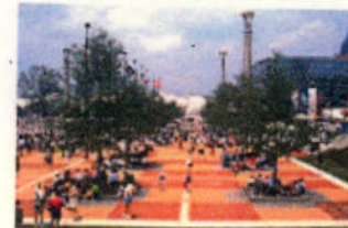
The open space 公共休憩空間

*The Proposal is subject to detailed design and images provided are for illustrative purpose only 擬議圖像僅作圖解之用，最終的詳細設計可能有出入