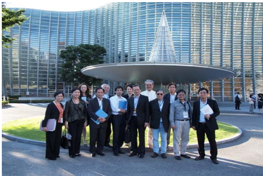
造訪國立新美術館

2.48 國立新美術館透過舉辦以不同年齡人士為對象的教育課程推廣外展活動，並透過講座、研討會、藝廊講座、工作坊、實習計劃及義工活動，讓公眾參與、互動及發揮創意。