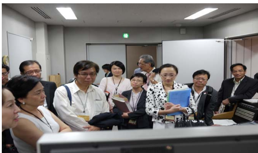
非物質文化遺產視聽紀錄展示