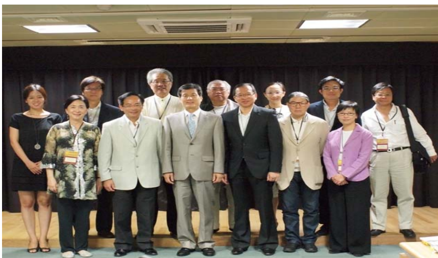
與韓國文化遺產基金會人員會晤

3.35 在訪問期間，訪問團觀賞了非物質文化遺產傳承人在重要非物質文化財產訓練工場示範韓國傳統手工藝，這類示範由該基金會舉辦。訪問團並聽取有關人員講解該基金會保存文化財產(包括非物質文化遺產)的主要職能。其中包括保護、保存、推展、推廣及善用文化財產；向遊客推廣"傳統儀式重現計劃"；舉行有關文化財產及傳統文化作品的展覽、講座、調查及研究；參與國際合作項目，以推展世界的非物質文化遺產；以及經營推廣韓國傳統文化的文化設施，例如重要非物質文化財產訓練中心和韓國之家。