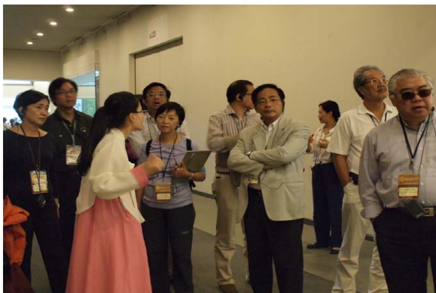
造訪韓國國立民俗博物館

兒童博物館及一個露天展覽館。除文物真跡外，館內亦展出多項複製品及畫作，顯示例如慶典及節日等傳統生活細節。訪問團察悉，韓國國立民俗博物館為加深公眾瞭解韓國的傳統文化藝術，提供多項免費表演，內容涵蓋韓國音樂、傳統舞蹈、武術及假面劇、各類展覽及傳統非物質文化項目等，廣受參觀人士歡迎。