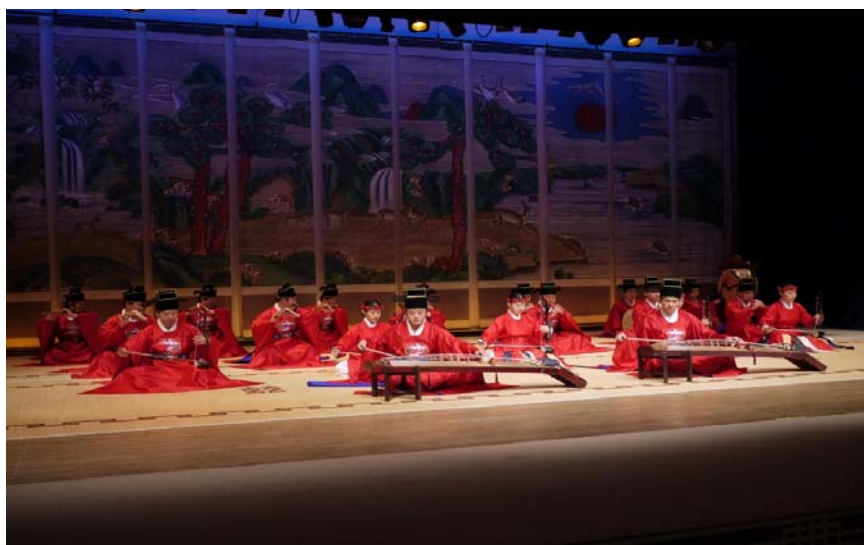
國立國樂院的傳統音樂表演