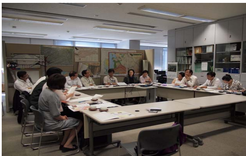
無形文化遺產部工作簡介