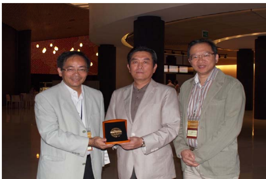
向美術館代表致送紀念品