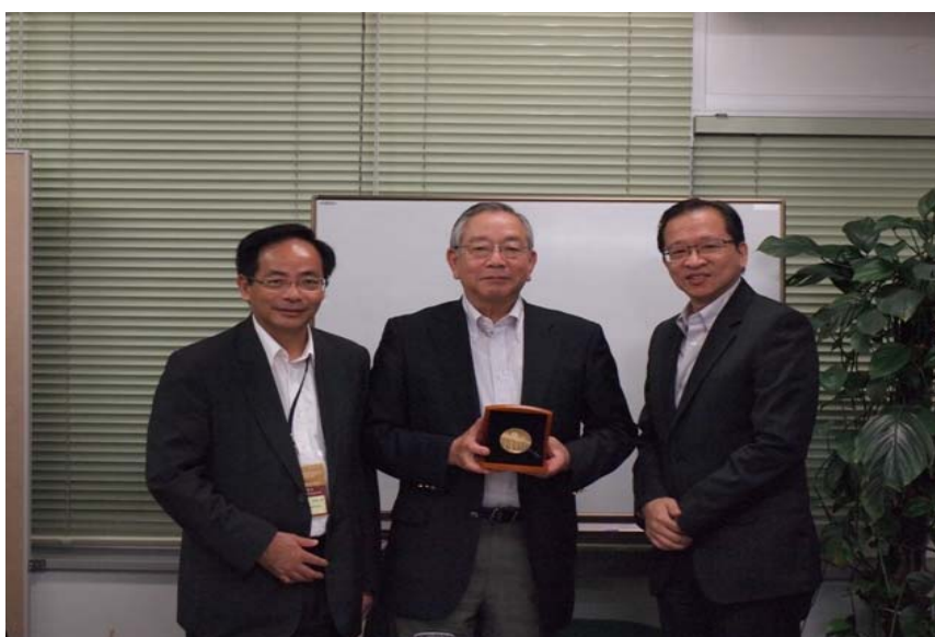
向日本企業支援藝術協議會的代表致送紀念品