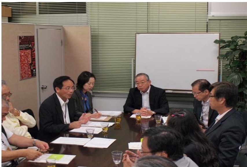
日本企業支援藝術協議會簡介尋求企業支援藝術的措施