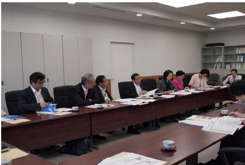
與文化廳官員討論日本保存非物質文化遺產的概況