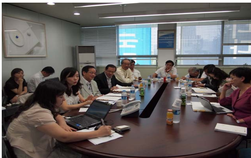
文化體育觀光部的工作簡介