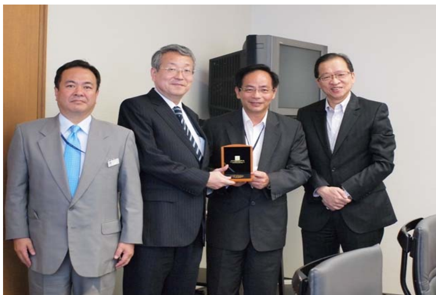
與新國立劇场的代表會晤

2.46 為吸引下一代進入歌劇的世界，新國立劇場自1997年起提供高中學生欣賞歌劇優惠，票價定為較相宜的2,100日圓(203港元)。該劇場於2004年起亦開設以小學學童為主要對象的兒童歌劇。歌劇劇目原來的音樂和劇本均重新編寫，讓兒童更易瞭解。票價亦定於每席2,100日圓(203港元)的相宜水平。此外，該劇場自2008年起亦為初中學生提供芭蕾舞表演，藉以令芭蕾舞藝術更深入民心、豐富社會的文化素養，以及促進年輕人的全人發展。