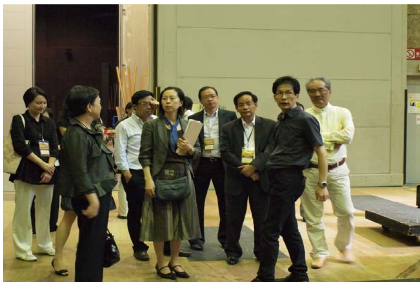
簡介新國立劇場所提供課程／活動