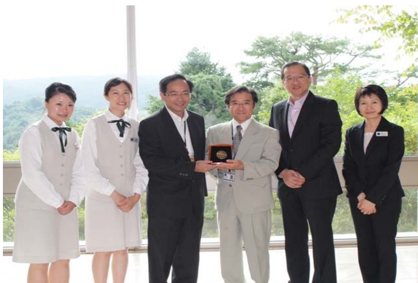
向美秀美術館的代表致送紀念品