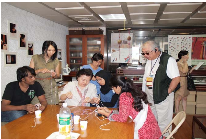
非物質文化遺產傳承人示範韓國傳統手工藝