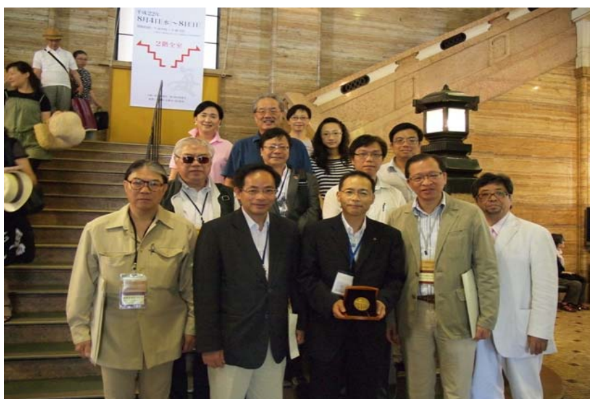
造訪京都市美術館