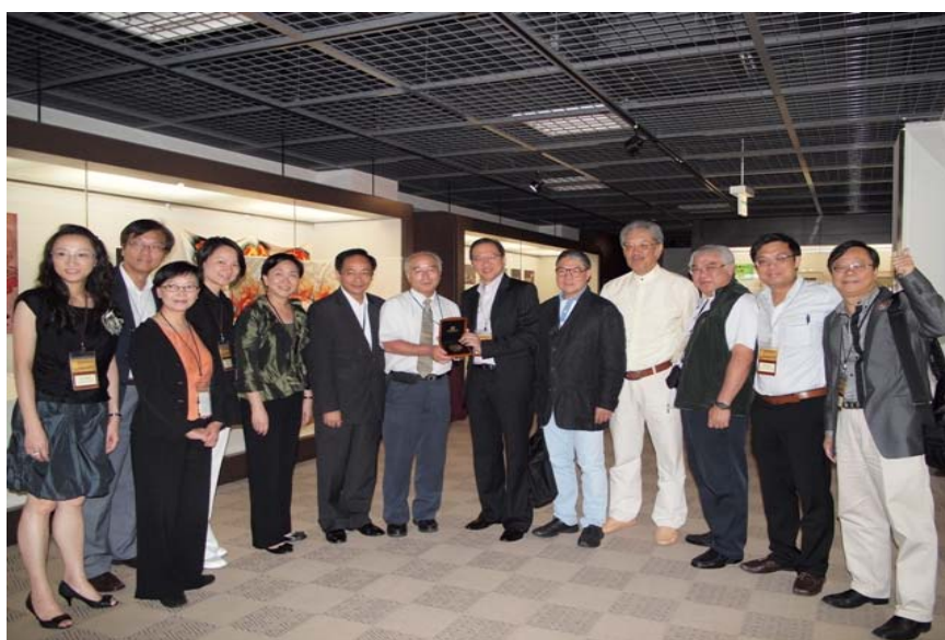
向國立劇場致送紀念品