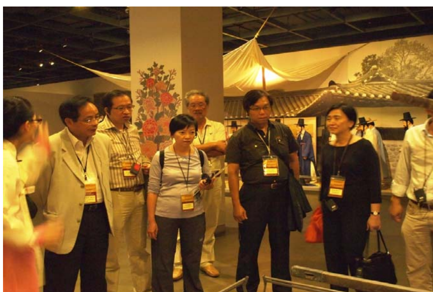
傳統韓國文化推廣節目的簡介