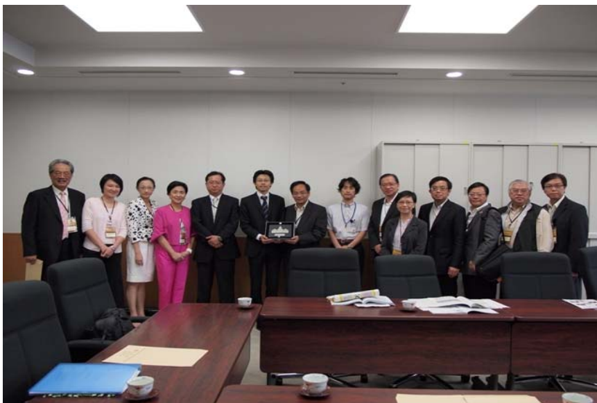
向文化廳代表致送紀念品