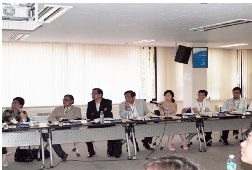
講解韓國文化藝術教育服務機構的工作