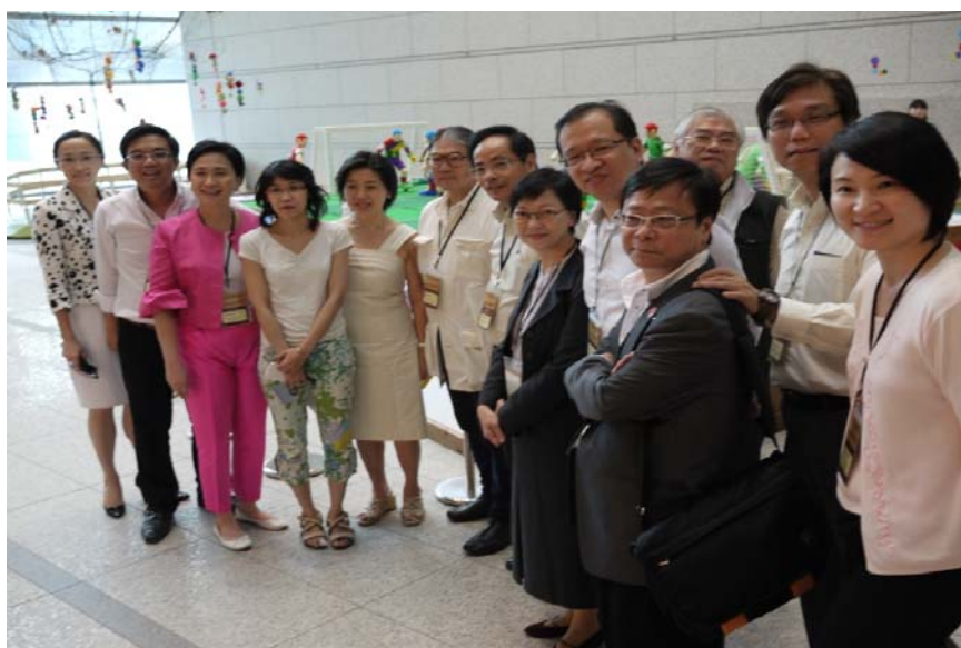
參觀東京都現代美術館的設施