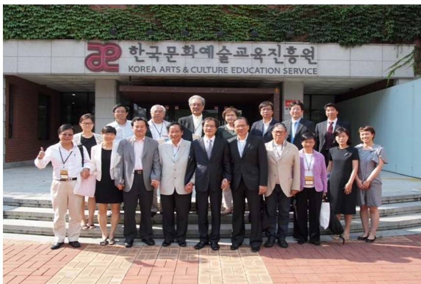
與韓國文化藝術教育服務機構的人員會晤

3.12 訪問團察悉，該國政府在2010年為文化藝術教育服務提供的撥款為412億韓圓(2億7,810萬港元)，較前一年度的預算增加14%。為推廣文化藝術教育，韓國文化藝術教育服務機構集中推行各項措施及計劃，擴大以學校及社區為本的文化藝術教育、發展人力資源和訓練藝術教育者、建立文化藝術教育網絡，以及探討市民大眾對文化藝術教育的支持程度。