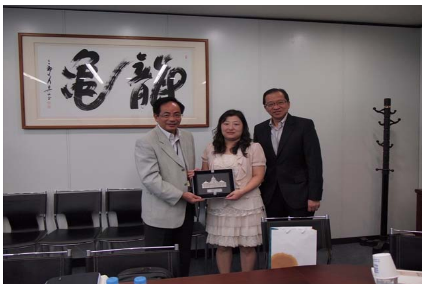
向文化體育觀光部的代表致送紀念品