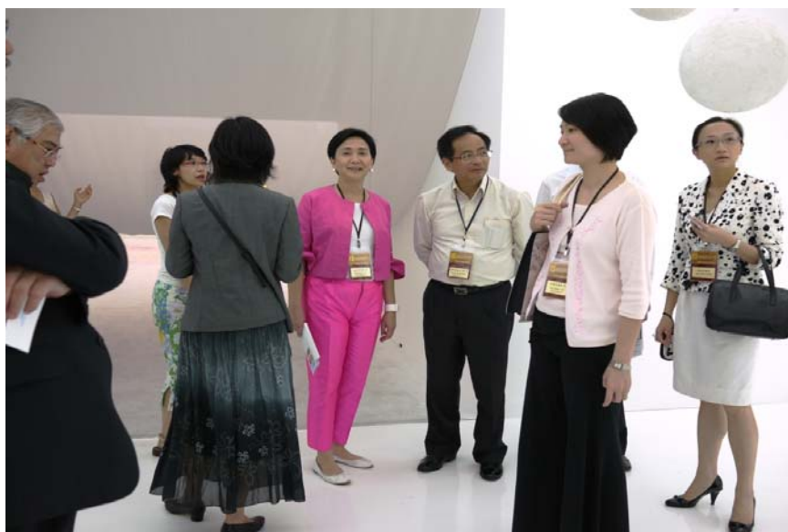
東京都現代美術館所提供教育活動項目的簡介