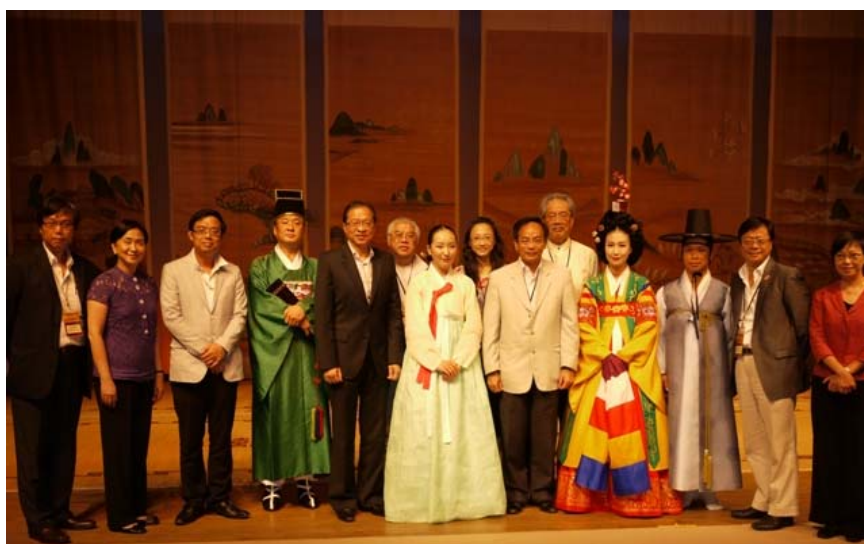
與國立國樂院的藝術家會面