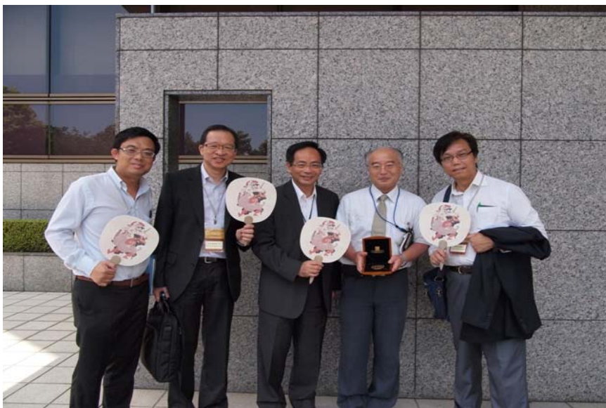
與日本藝術文化振興會的代表交換紀念品