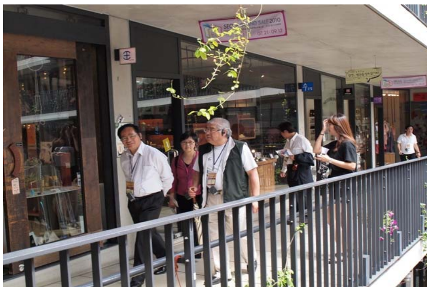
參觀仁寺洞文化區的設施