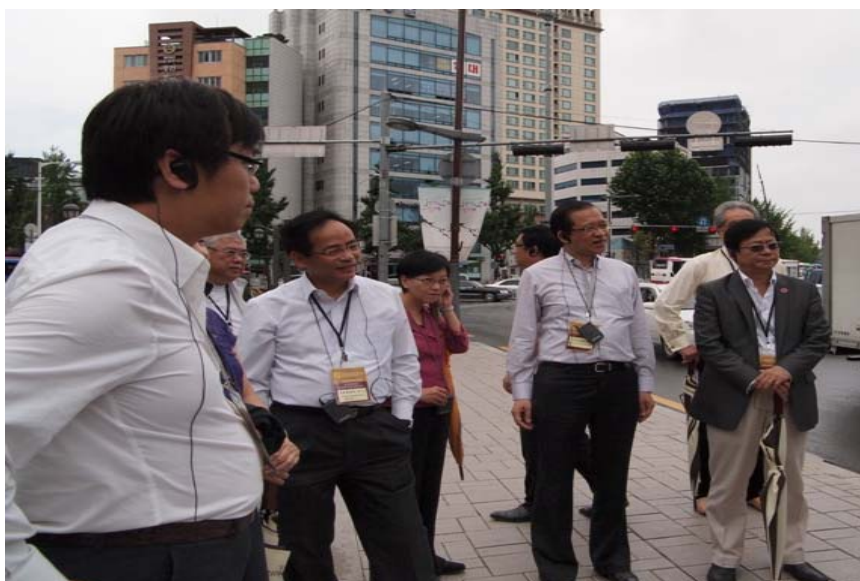
仁寺洞文化區歷史的簡介

3.47 訪問團察悉，大部分昔日屬於官商巨賈的傳統建築物現已變為具有獨特時空形像及品牌的餐飲店或商鋪，每個星期日均吸引大約10萬名遊客前往參觀。該處每年舉行仁寺洞傳統文化節，進行包括陶藝製作秀、家訓書藝表演、稻草工藝、肖像畫及傳統搗年糕等特色活動；加上其他慶典如古美術節及現代美術節，都為該區平添更多吸引遊客的魅力。