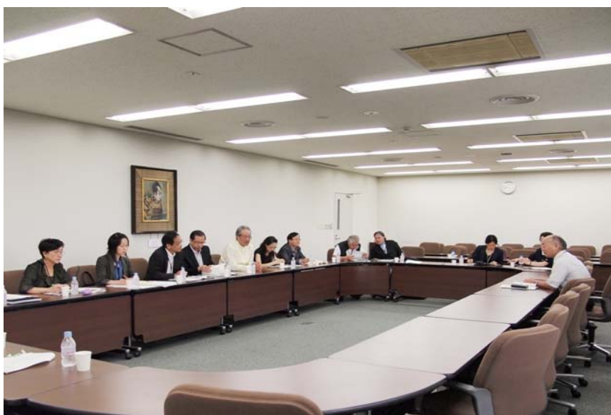
日本藝術文化振興會的工作簡介

2.34 日本藝術文化振興會的財政預算分為3部分：藝術文化振興基金的預算、國立劇場的預算及新國立劇場的預算。藝術文化振興基金(在2009年合計有541億日圓(52億港元)的政府資助及112億日圓(10億港元)的私營機構捐款)用於推廣日本的藝術和文化活動。國立劇場的預算獲門票銷售、出租設施收益，以及政府的撥款和津貼支持，用於資助進行公開表演、培訓及研究的支出。新國立劇場的預算則來自出租設施收益及政府撥款，用於管理新國立劇場。