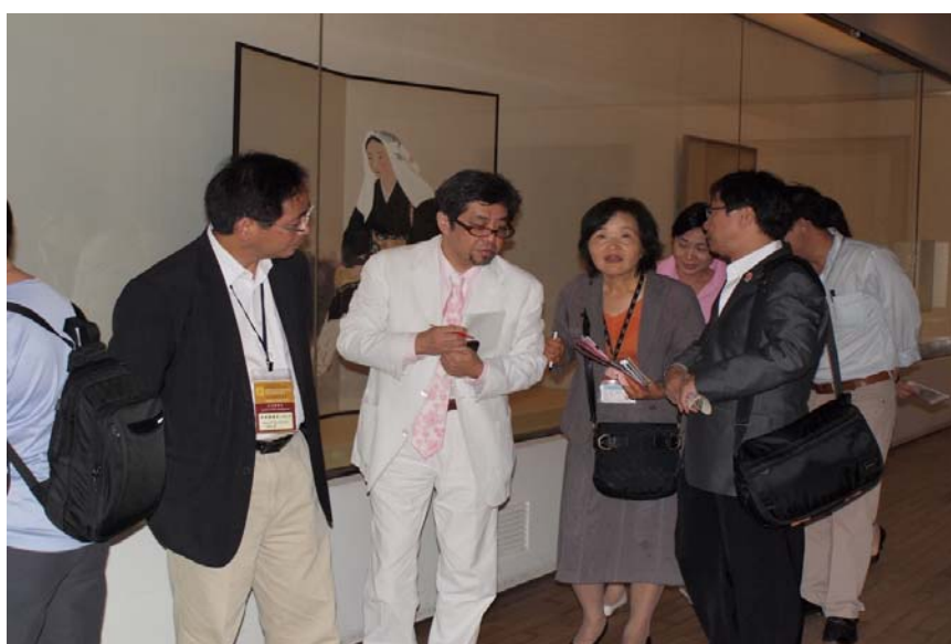
京都市美術館展覽項目的簡介