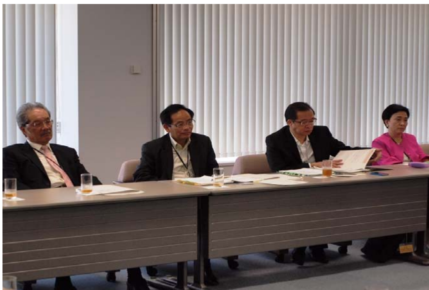
財團法人地域創造透過文化藝術 促進地區發展的工作簡介