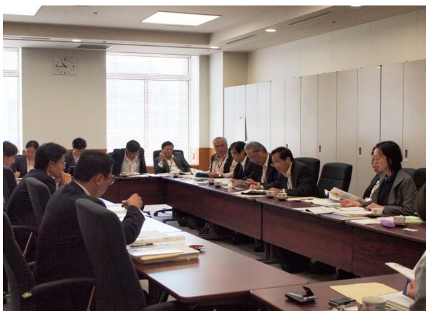
文化廳官員簡介日本推動文化發展的措施