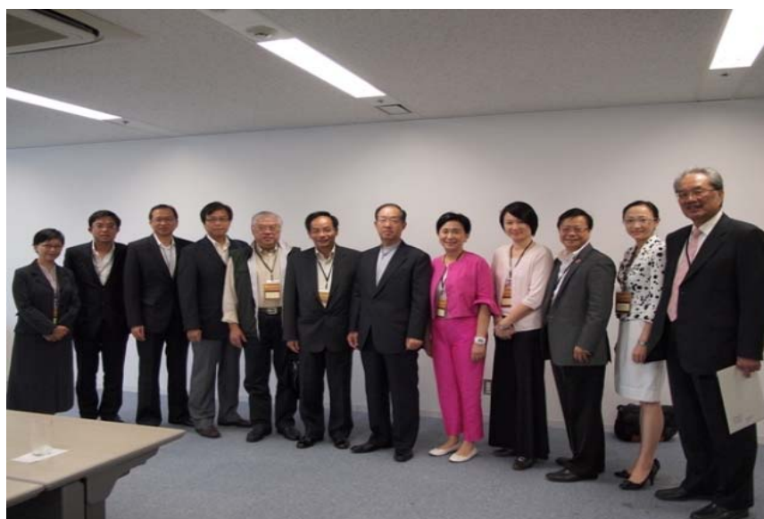
與財團法人地域創造的代表會晤

2.13 據財團法人地域創造所述，該法人團體的營運經費來自地方政府的撥款、獎券基金及競艇收入。其主要活動包括：支援公共文化設施、為設施管理人員提供培訓機會、進行研究、出版刊物、為藝術工作者及藝術專才推薦工作、為博物館提供支援服務、支持地方傳統藝術的傳承、建立資料庫，以及向卓越的藝術工作者頒發獎項。