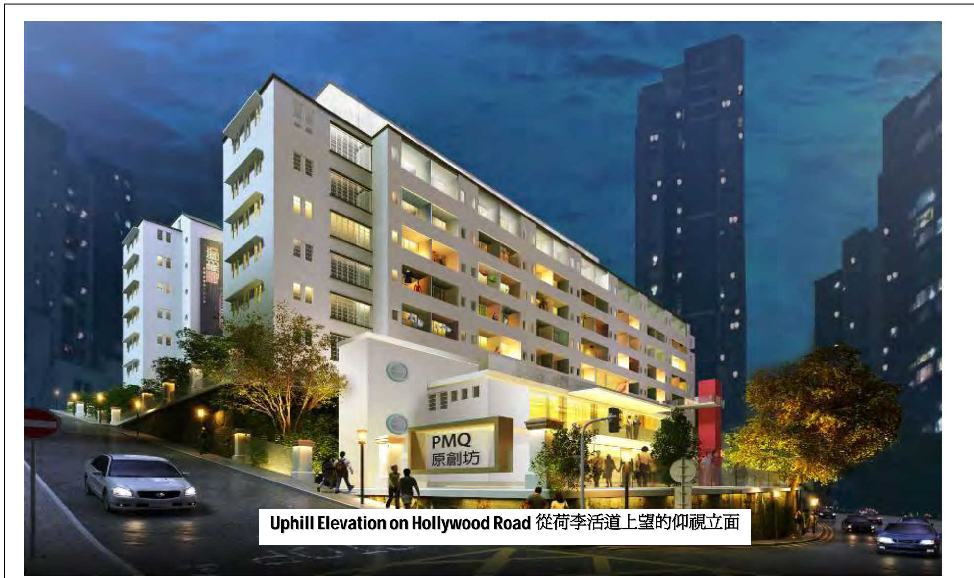
Uphill Elevation on Hollywood Road 從荷李活道上望的仰視立面