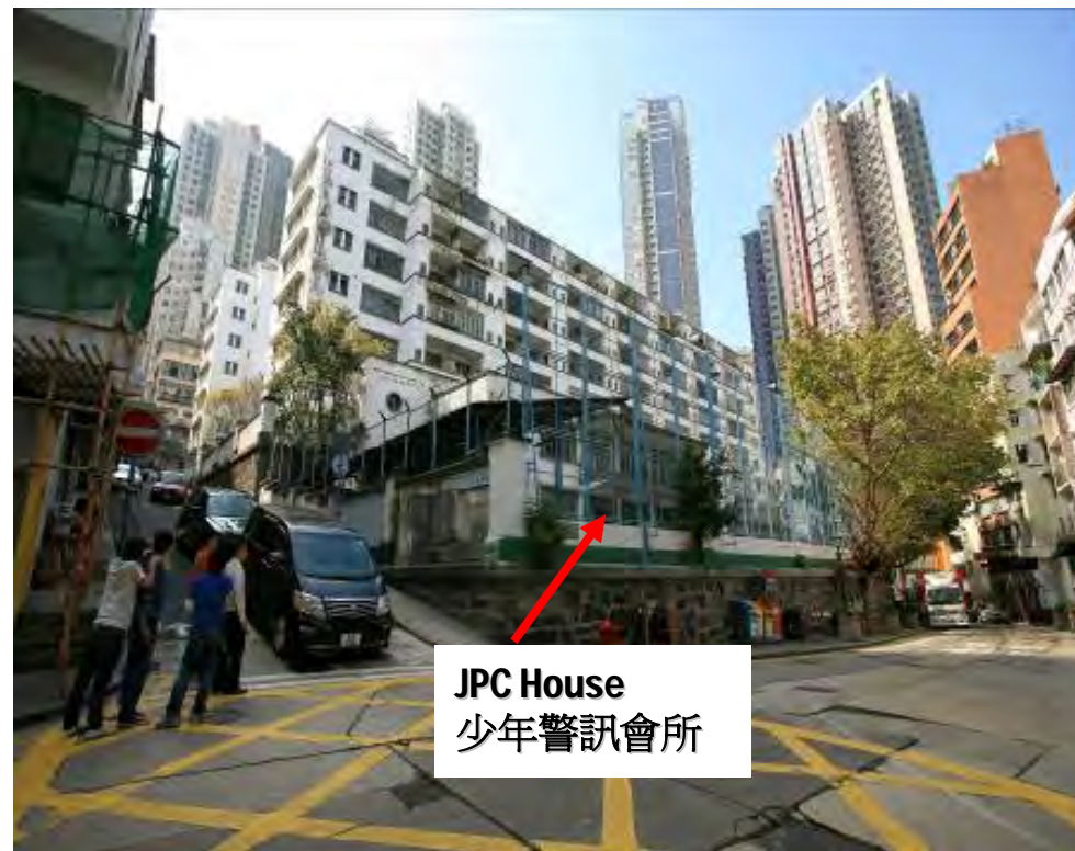
JPC House 少年警訊會所