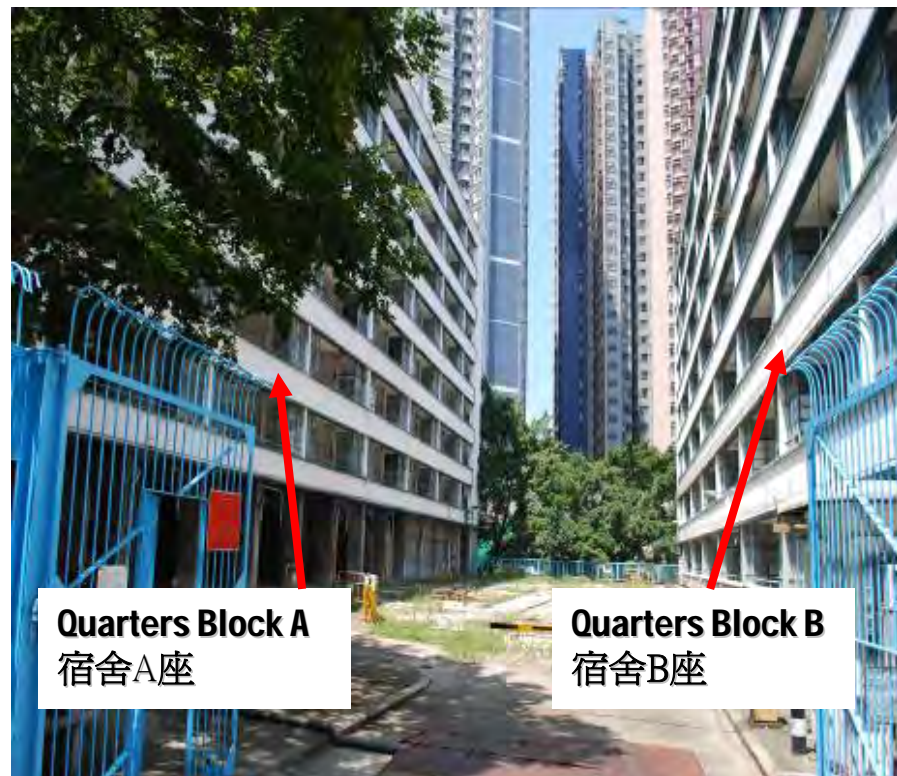
Quarters Block A 宿舍A座