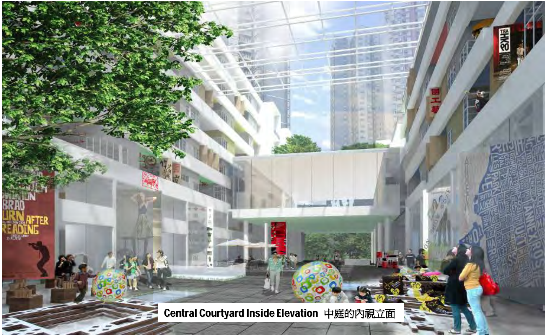
Central Courtyard Inside Elevation 中庭的內視立面