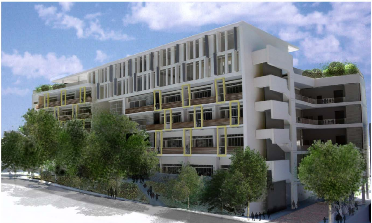
VIEW OF THE NEW SCHOOL PREMISES FROM PERTH STREET 從巴富街望向校舍構思圖