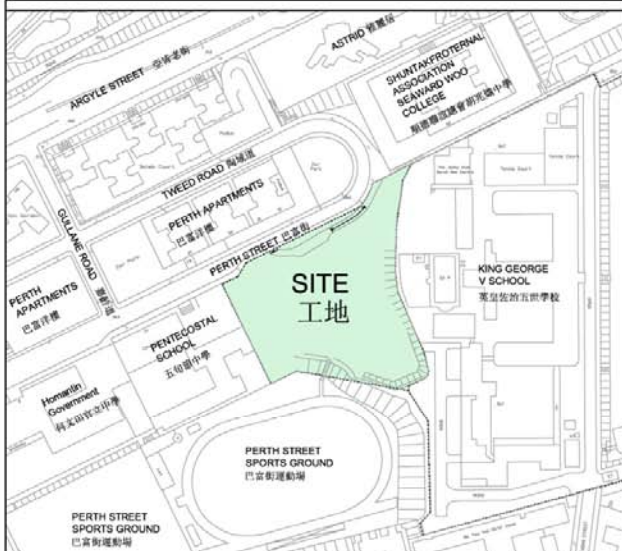
位置圖 LOCATION PLAN 1 : 3500