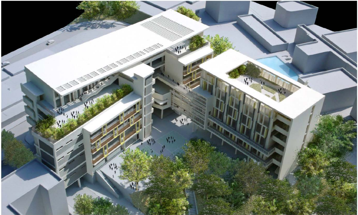
AERIAL VIEW OF THE NEW SCHOOL PREMISES FROM PERTH STREET SPORTS GROUND 從巴富街運動場望向校舍鳥瞰構思圖