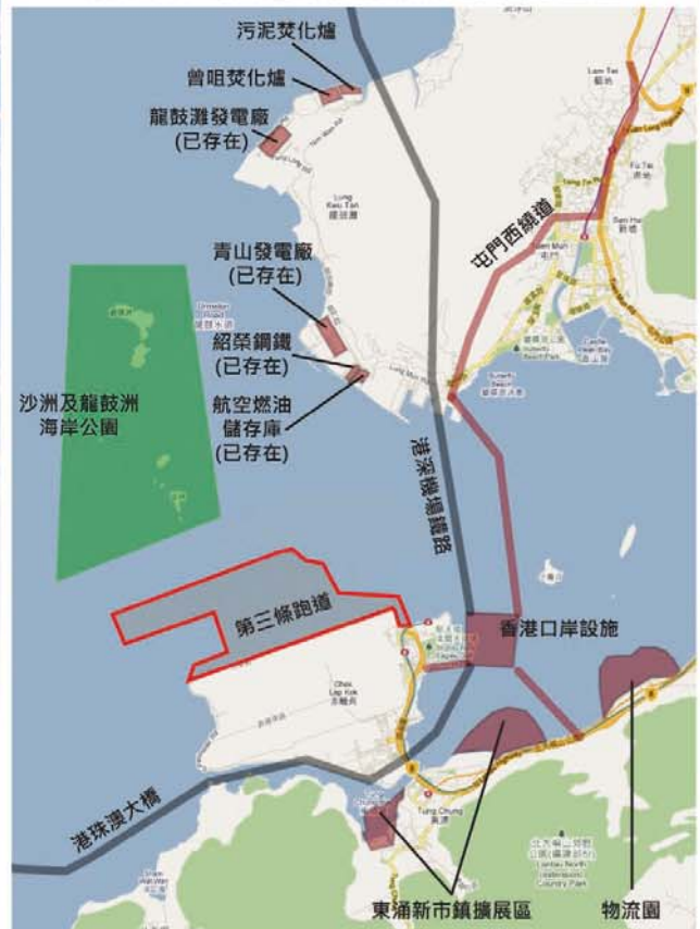
北大嶼山及屯門現存及規劃中的基建

FACEBOOK： http://www.greensense.org.hk/anti_third_runway