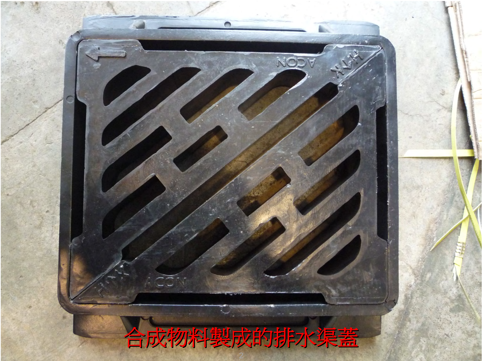
合成物料製成的排水渠蓋