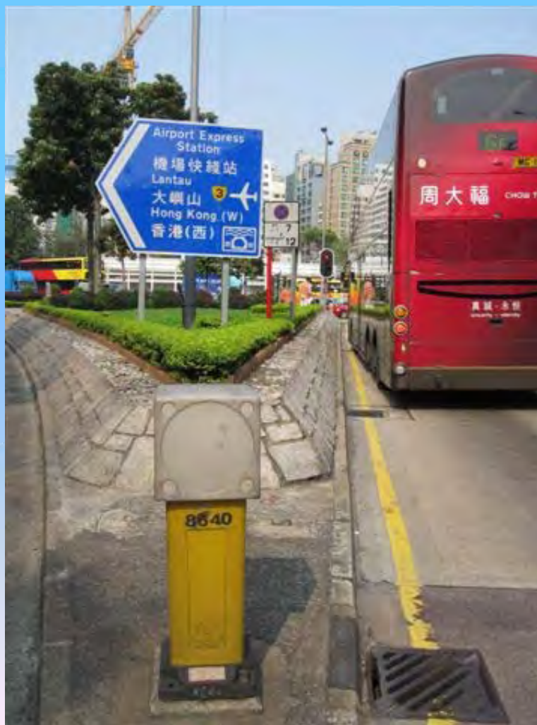
有照明裝置的傳統安全島標柱