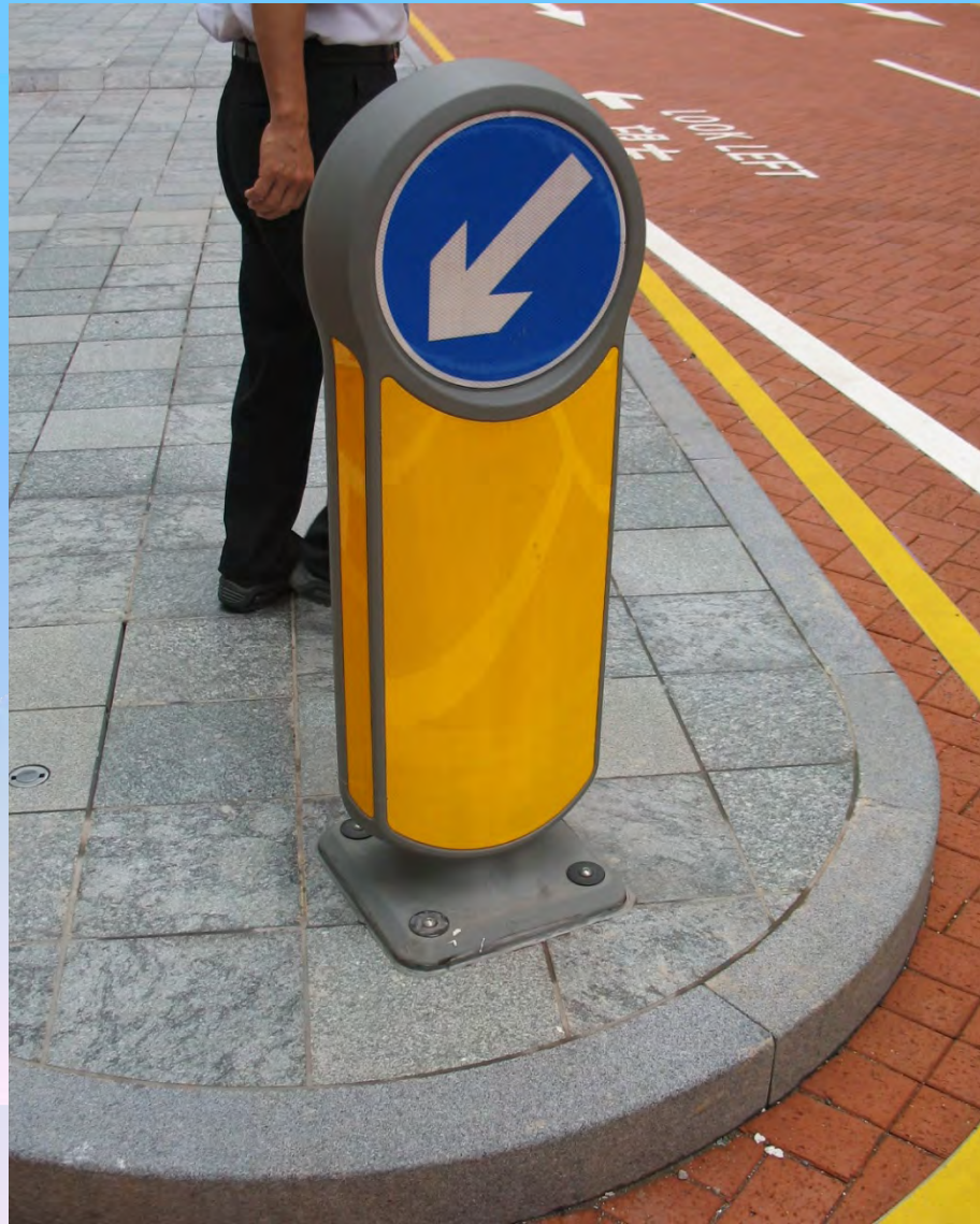
無照明裝置的反光安全島標柱