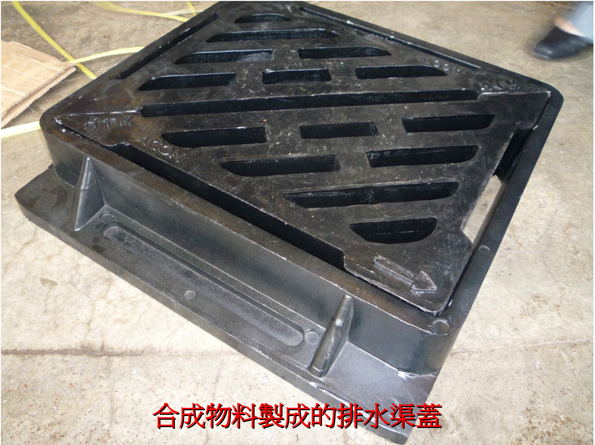
合成物料製成的排水渠蓋