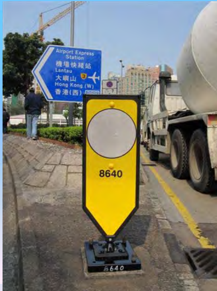
無照明裝置的反光安全島標柱