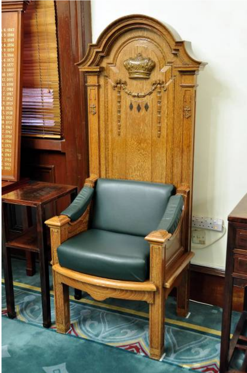
由康樂及文化事務署香港歷史博物館借出的前立法局主席座椅，將於立法會大樓開放日展出。