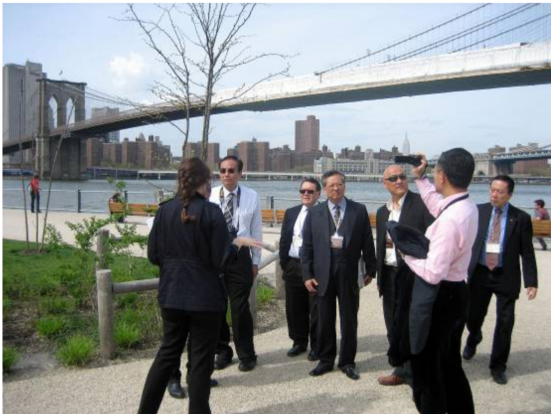
訪問團成員聽取布魯克林大橋公園發展公司的代表簡介布魯克林大橋公園的的規劃、建造、保養及營運事宜。