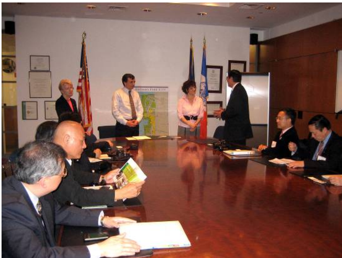
立法會海濱規劃事宜小組委員會訪問團與砲台公園城管理局的代表會晤，討論紐約砲台公園城的管理事宜，以便能就採用公私營機構合作模式發展公園城作更深入的瞭解。