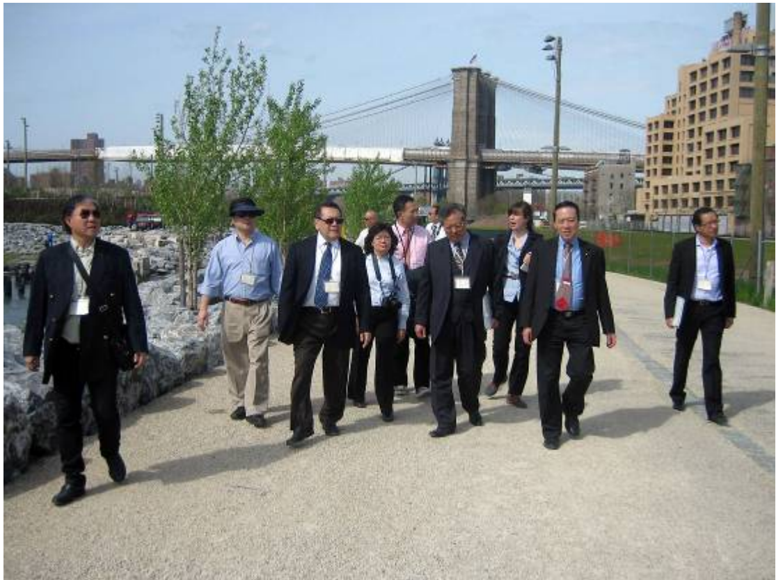
訪問團成員參觀紐約布魯克林大橋公園。