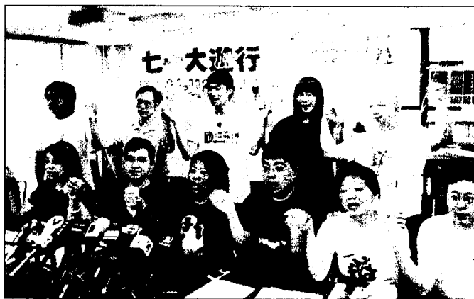
Organizers of the July 1 march are geared up for the 'big rally.'