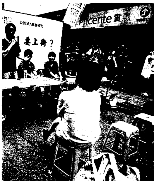
■多個民間團體昨日在旺角行人專用區舉行活動，為「7.1」上街造勢，但到場出席市民較少，多張空椅冇人坐。