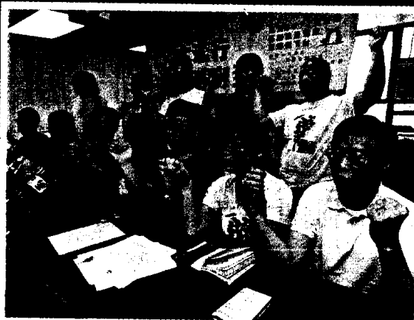
■民陣昨日呼籲市民7.1上街，捍衛言論和表達自由。

【本報訊】警方繼阻撓市民參加今年的六四集會後，又試圖重施故技，突向主辦 7.1 遊行的民陣表示，若屆時遊行人數「太多」，會採取「應變安排」，強制市民「遊花園」才能到達遊行起步點。有民陣成員發現，警方「應變安排」的路線一旦遇上人潮，將令市民至少花半