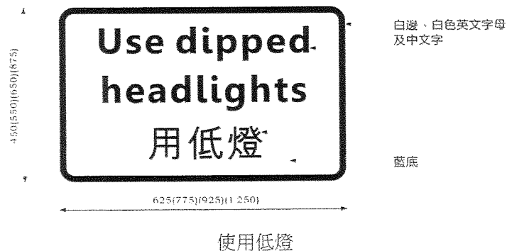
“第 5 號圖形