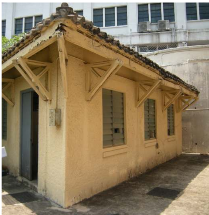
Photos of the 1926 building 1926年建築物的相片