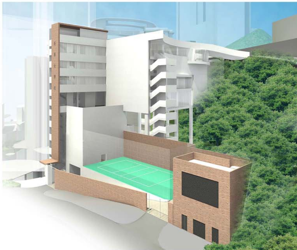
於卑利士道從東面望向重建項目「乙」地盤的構思圖 VIEW OF SITE B REDEVELOPMENT FROM EAST AT BREEZY PATH (ARTIST'S IMPRESSION)