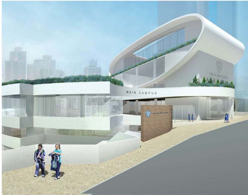
於羅便臣道從西面望向重建項目「甲」地盤的構思圖 VIEW OF SITE A REDEVELOPMENT FROM WEST AT ROBINSON ROAD (ARTIST'S IMPRESSION)