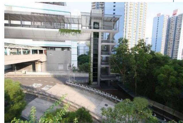
慈雲山行人設施改善工程

Improvement works of pedestrian facilities in Tsz Wan Shan