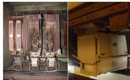
涉及港島綫事故的車載斷路器