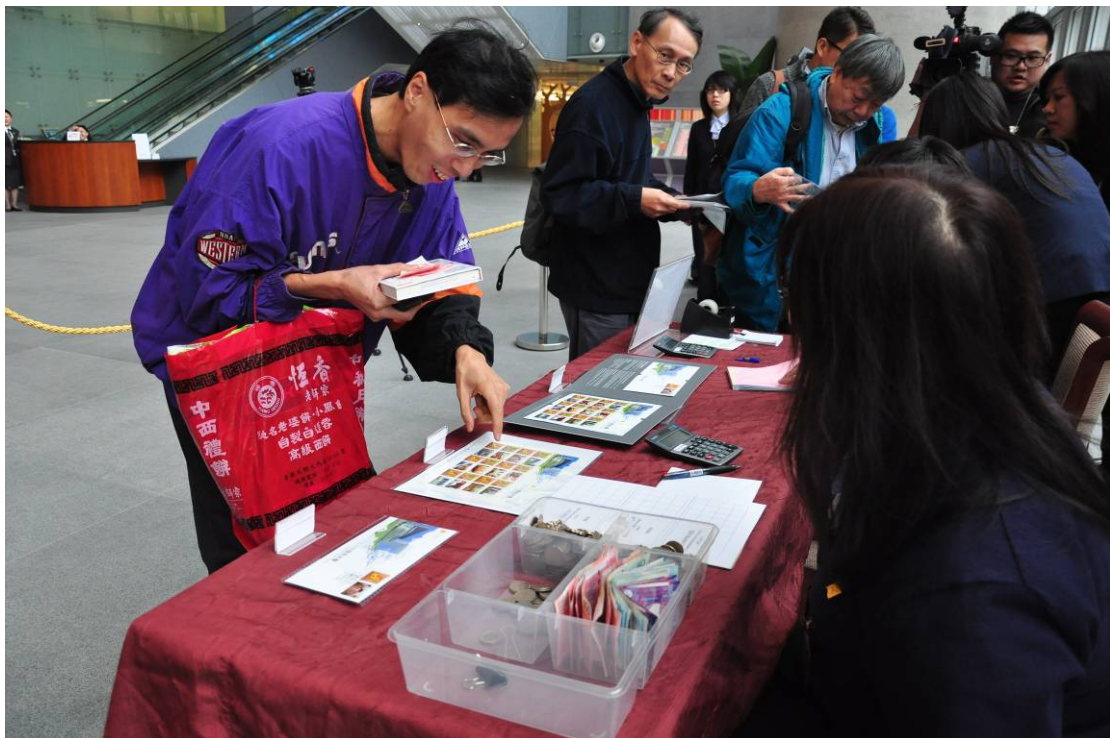
「立法會綜合大樓」紀念郵票深受集郵人士歡迎。一名訪客對展現綜合大樓不同特色的紀念郵票很感興趣。