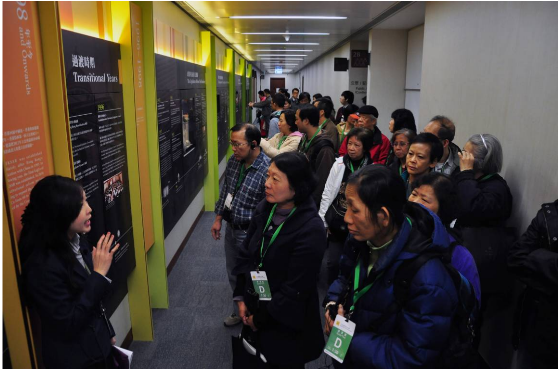
參加導賞團的人士透過歷史長廊有趣的展品了解有關香港立法機關的歷史。