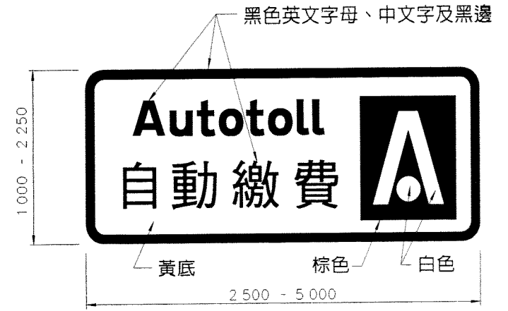
行車綫 (只准自動繳費車輛)

本標誌於通往自動收費亭的行車綫上方展示，顯示該行車綫只供已配備有效電子代用證並屬該證之戶口所關乎的車輛行駛。”。