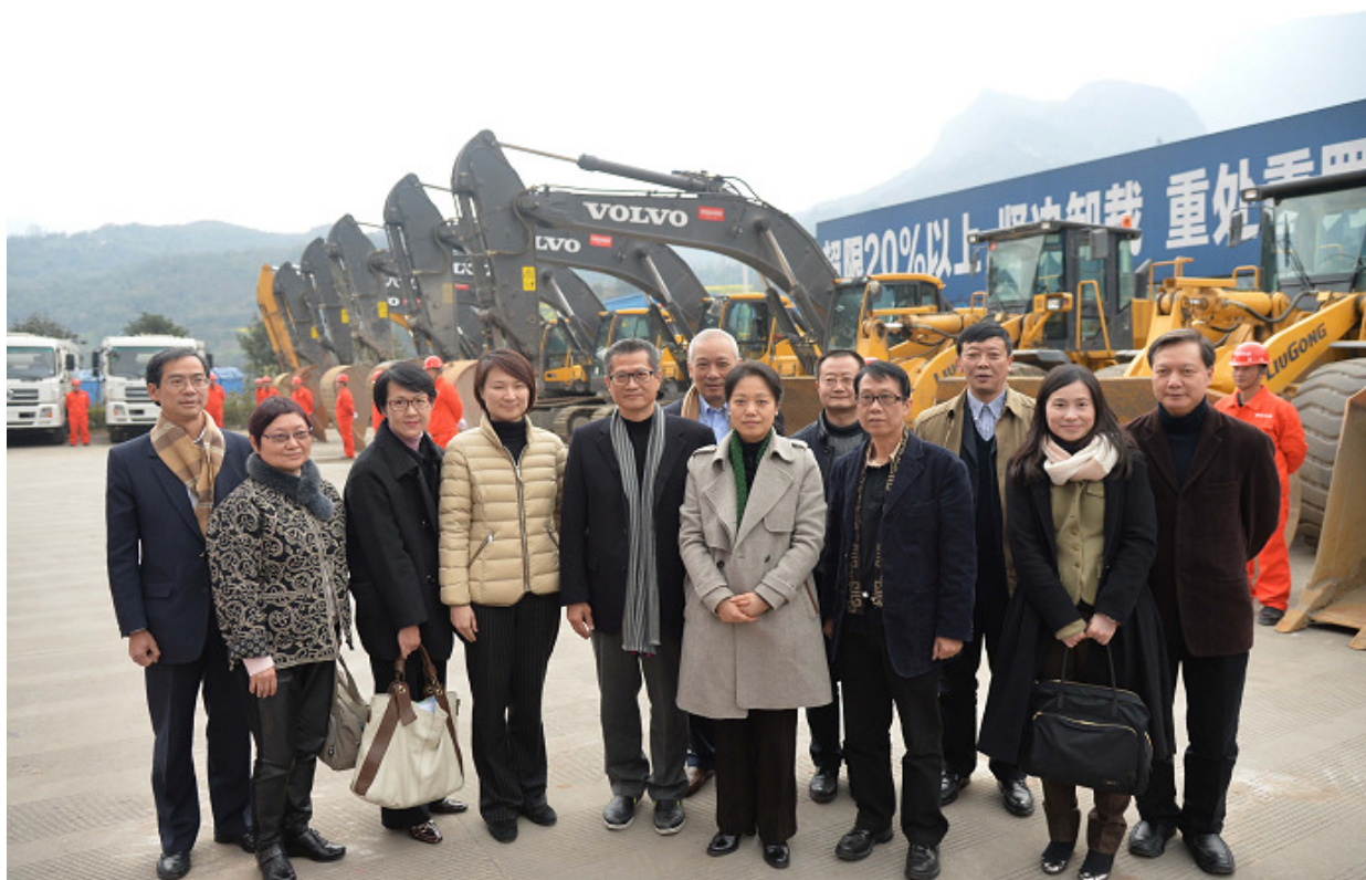
▲ 特區政府訪問團與內地官員於挖掘機前合照留念