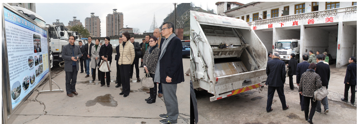
▲訪問團到雅安市環衛處參觀環衛設備