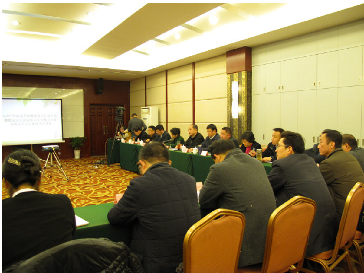
▲ 訪問團出席雅安市就一億港元捐款的使用情況的簡報會