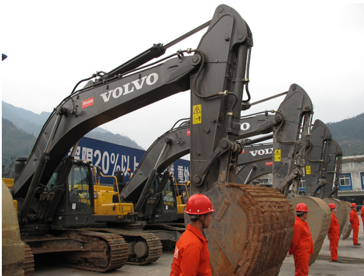
▲ 挖掘機及裝載機在清除通道的飛石、泥石流等發揮了關鍵作用