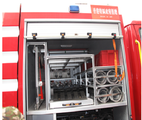
▲雅安市消防支隊展示以特區政府捐款購置的多輛水罐消防車