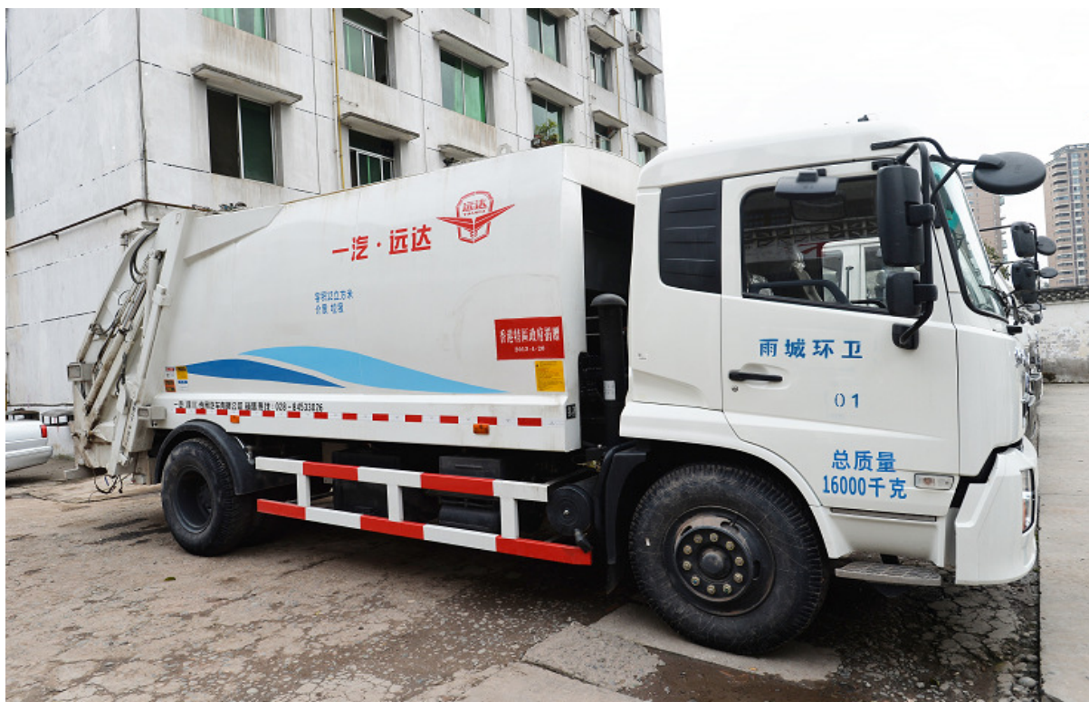
▲ 以特區政府捐款購置的環衛清掃車、環衛灑水車、垃圾清運車及垃圾壓縮車