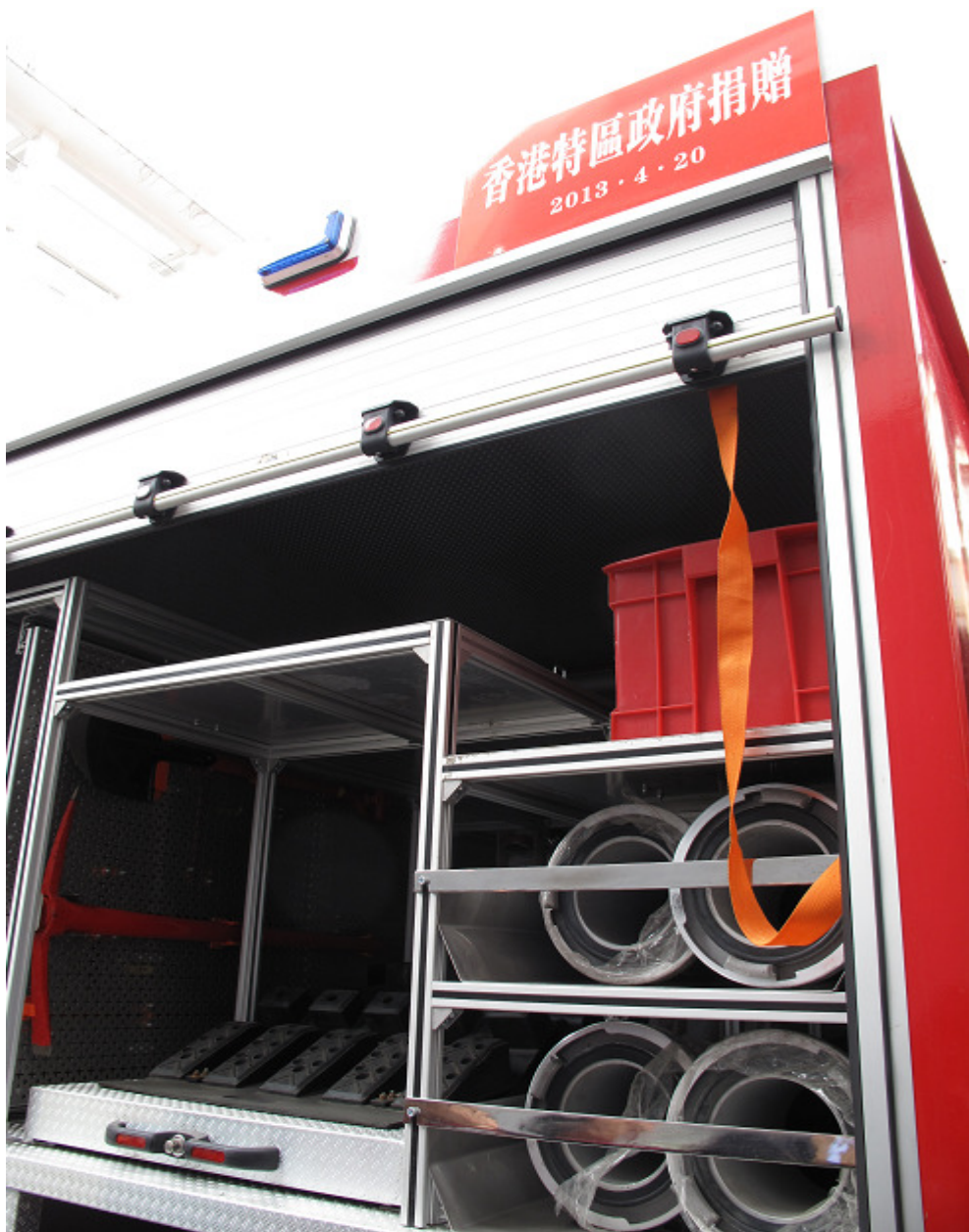
▲ 以特區政府捐款購置的消防車投入執勤行列

15. 雅安市政府以捐款購置的 15 台消防類設備(市 3 台，縣 12 台)已投入執勤服務，消防隊伍的應急處理能力得以提升，並可有效地在災後挽救人命及免卻財產損失。