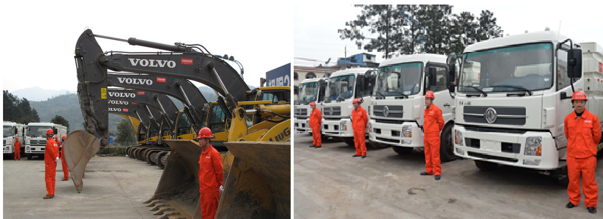
▲ 各款挖掘機及裝載機是最早到位的搶險設備