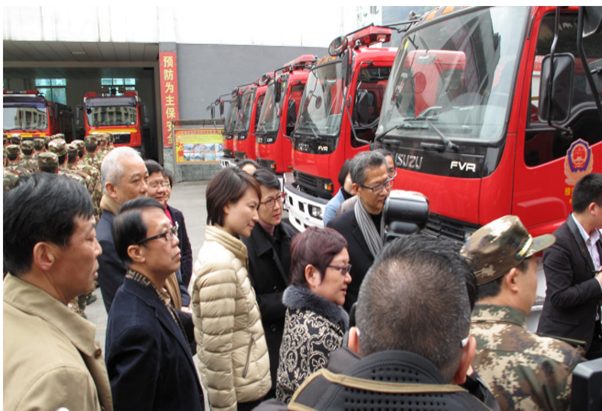
▲ 訪問團到雅安市消防支隊聽取有關消防救災設備的介紹