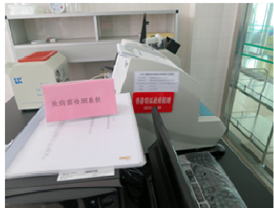
▲ 雅安市疾病預防控制中心展示以特區政府捐款購置的各種衛生防疫類設備