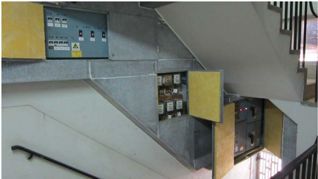
配電箱及電錶設備通過測試