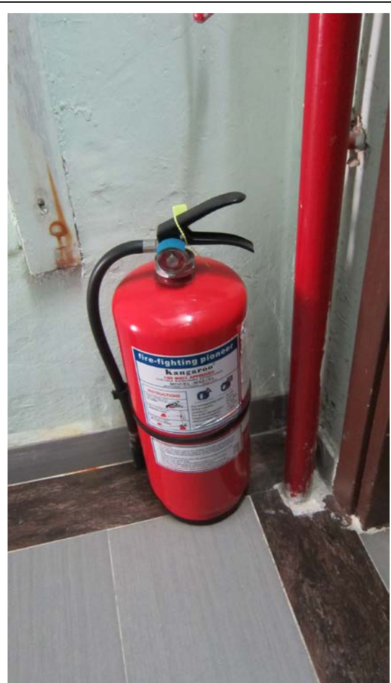
消防裝置設備 (滅火筒)