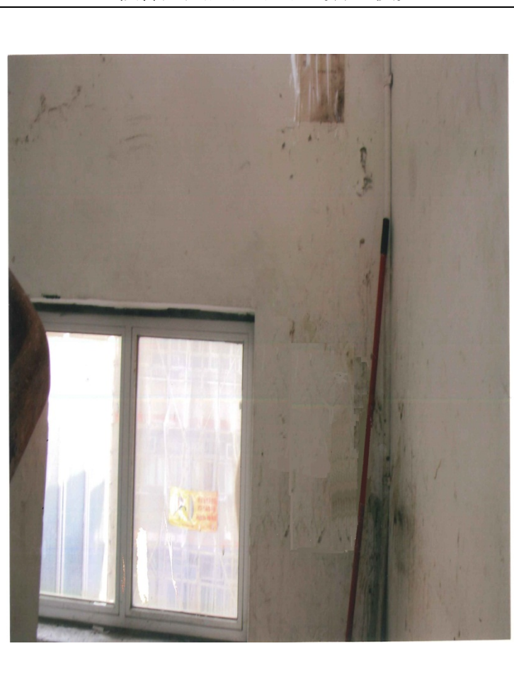
樓梯走火通道 五樓 (清理後)