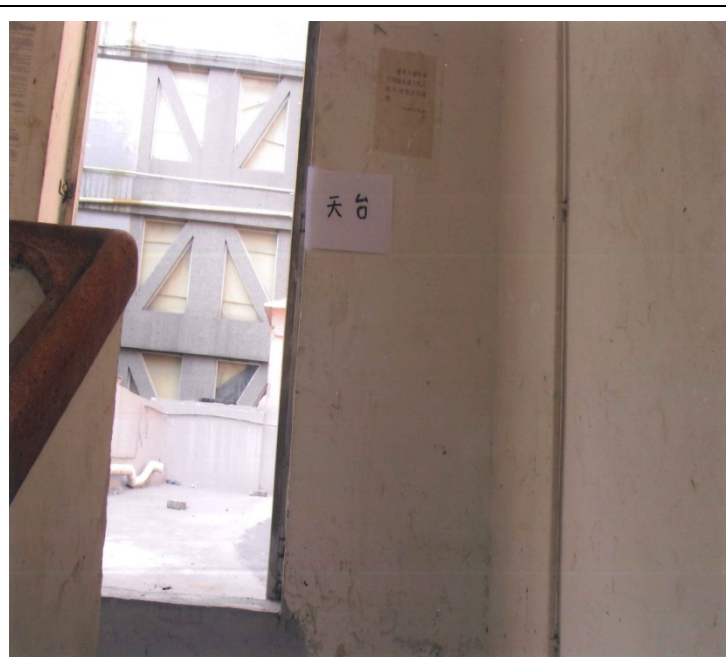
樓梯走火通道 天台 (清理後)