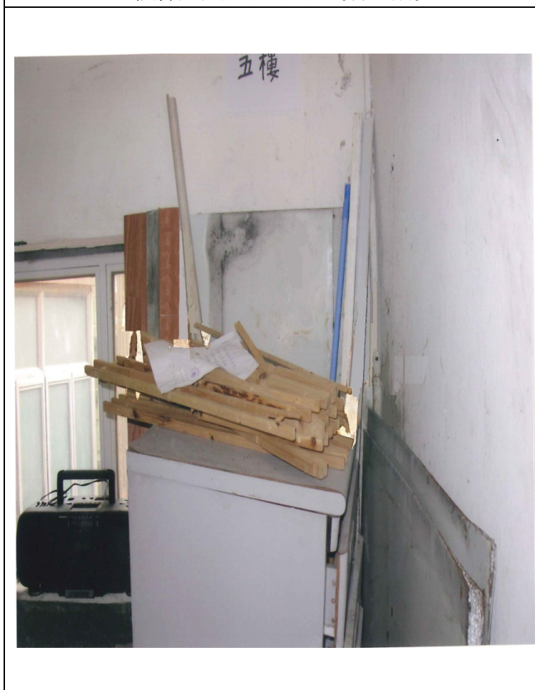
樓梯走火通道 五樓 (清理前)