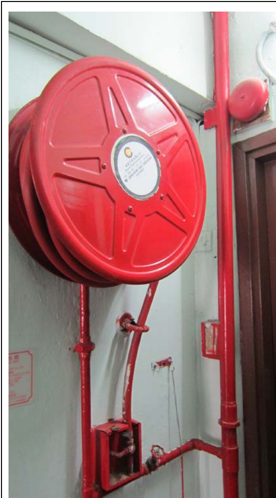
消防裝置設備 (消防喉轆)