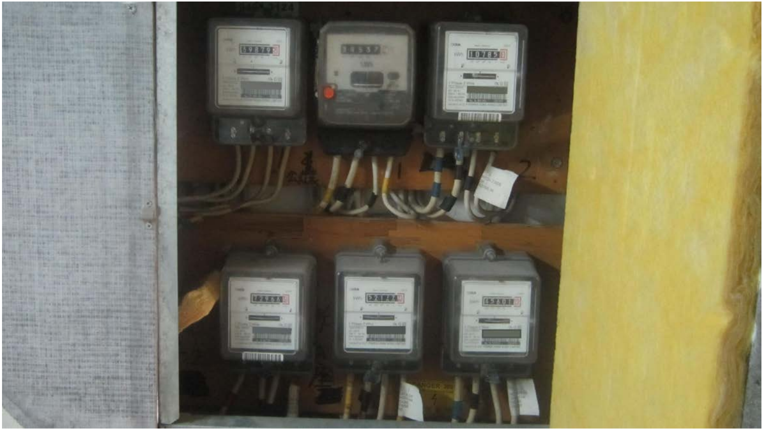
大廈電力裝置設備