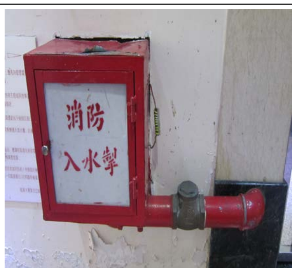
消防裝置設備 (消防入水掣)