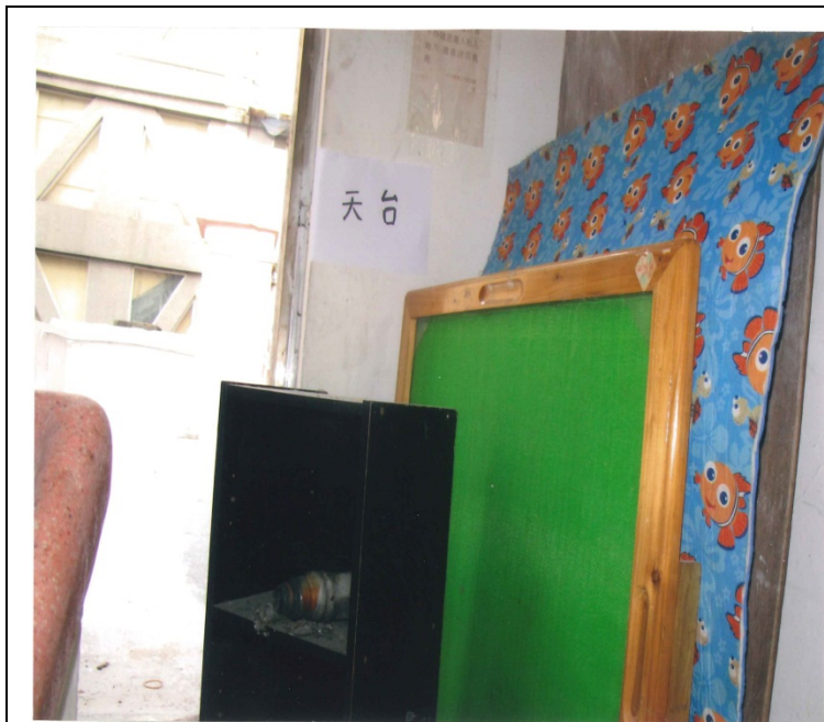
樓梯走火通道 天台 (清理前)