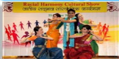
巴基斯坦及尼泊爾社區支援小組