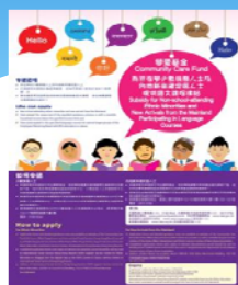
關愛基金資助項目