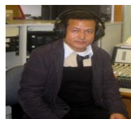
少數族裔語言廣播的電台節目