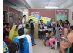
「家愛學堂」少數族裔學童與家長支援計劃