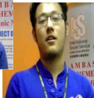
少數族裔工作人員和大使