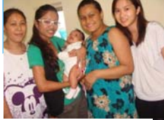
鄰舍互助天使計劃