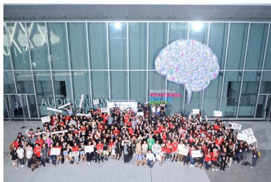
2012 年舉辦的球設計夏令營的相片

環球設計夏令營活動首次在 2012 年舉辦。活動的第一部分安排了 50 位本地大專院校的設計系同學參與了 4 月舉行的米蘭設計研習之旅，探訪著名的米蘭國際傢俬展 2012。同學們並有機會體驗米蘭深厚的設計文化。活動的第二部分是在 2012 年 7 月 1 日至 10 日在香港舉行的環球設計夏令營，約 200 位大專設計院校學生(包括約 100 位海外學生)參與，進行文化交流以及分享設計體驗。