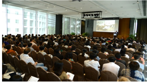
第四屆亞洲博物館網絡會議的相片