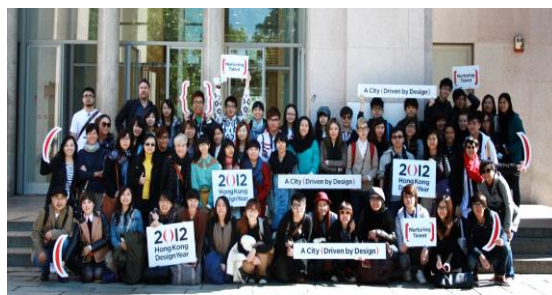
2012 年舉辦的米蘭設計研習之旅的相片

「妙法自然」展覽在 2012 年 7 月初至 8 月初於香港的 ArtisTree 舉行，旨在提高大眾對書法的興趣和認識，以及書法與設計有何關聯。是次展覽展出了台灣當代著名書法家董陽孜女士的《二十四帖書法字》，還有多位亞洲及本地平面設計師及一些設計系學生設計的海報。活動吸引了逾 11 000 人參觀。