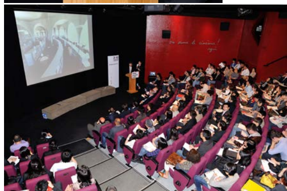
香港設計年「名師對話」的相片