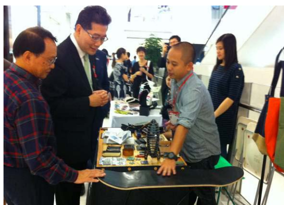
創意市集 2012 的相片