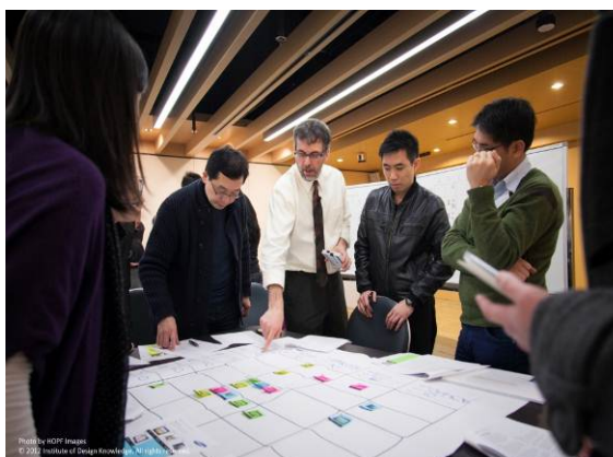
設計知識學院的相片