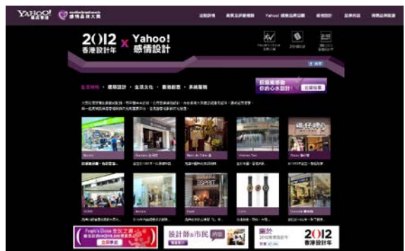
「感情設計」活動的相片

設計中心與 Yahoo! HK 合作舉辦 感情設計 這項活動，讓香港網民投票選出心目中的感情設計。其間有逾 170 000 人投票。