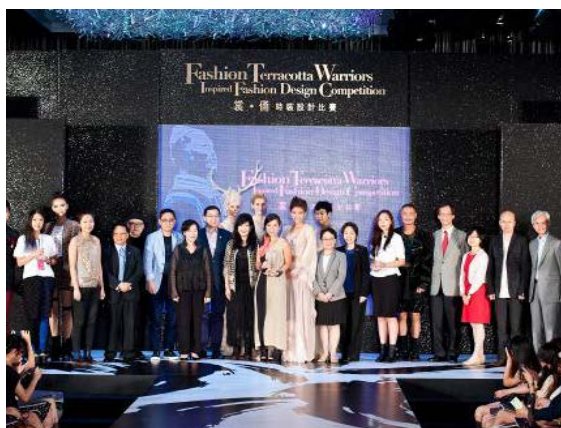
『由兵馬俑啟發設計』公共藝術活動的相片