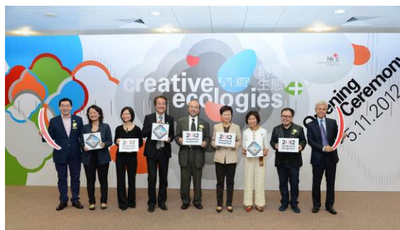
創意生態及創意生態+展覽的相片