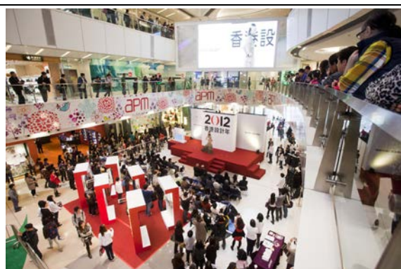
香港設計年@apm 的相片

香港設計年@apm 於 2012 年 3 月舉行講座，由相關專家分享設計價值及香港獨特的設計特色，又與聽眾玩遊戲，更安排了時裝表演。