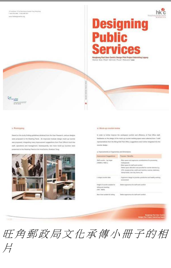
旺角郵政局文化承傳小冊子的相片

設計中心正在編制一本有關旺角郵政局翻新工程的文化承傳小冊子，作為日後提供公共服務項目的參考指引。