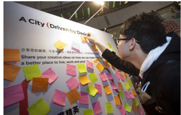
「設計，我話」計劃的相片

設計中心與 Yahoo! HK 合作舉辦 感情設計 這項活動，讓香港網民投票選出心目中的感情設計。其間有逾 170 000 人投票。