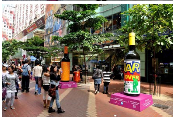
酒瓶藝術裝置的相片