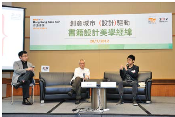
香港書展 2012 的相片

設計中心與香港旅遊發展局合辦酒瓶藝術裝置這項活動，作為香港美酒佳餚月的項目之一，在 2012 年 10 月至 11 月底期間，於多個旅遊景點展示合共 30 個由 11 名本地著名設計師創作的巨型酒瓶。