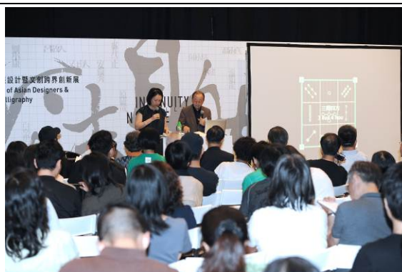
「妙法自然」展覽的相片

創意生態+ 展覽於 2012 年 11 月至 2013 年 1 月初在香港文化博物館舉行，是為香港設計中心(設計中心)成立十周年特別呈獻的活動。是次展覽旨在呈現香港設計業的發展進程，以及香港及其他亞洲城市的創意設計的發展脈絡，並展示了由本地知名設計師創作、風格各異而又別樹一幟的作品。活動吸引了逾 32 000 人參觀。