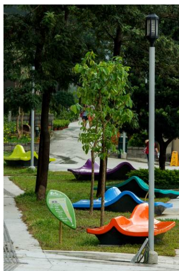
歌和老街公園開幕典禮 2012 的相片