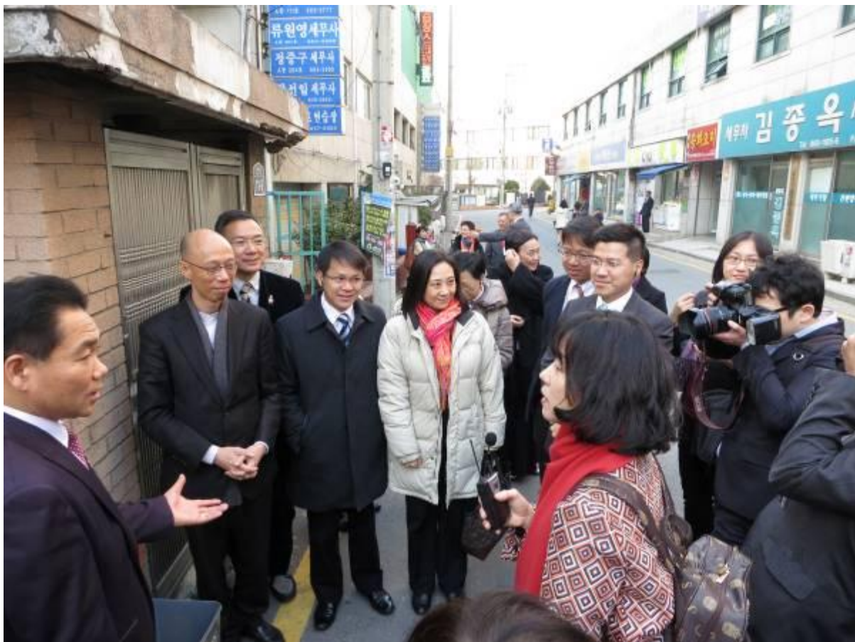
訪問團到衿川的住宅區和商業區視察廢物按量徵費系統及廚餘回收的運作情況。