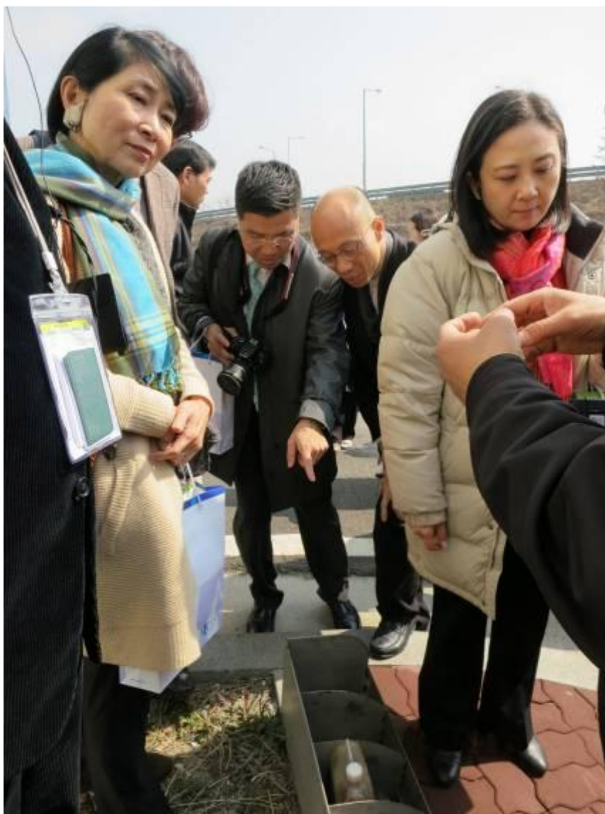
訪問團參觀松坡資源回收中心的廚餘回收產品。