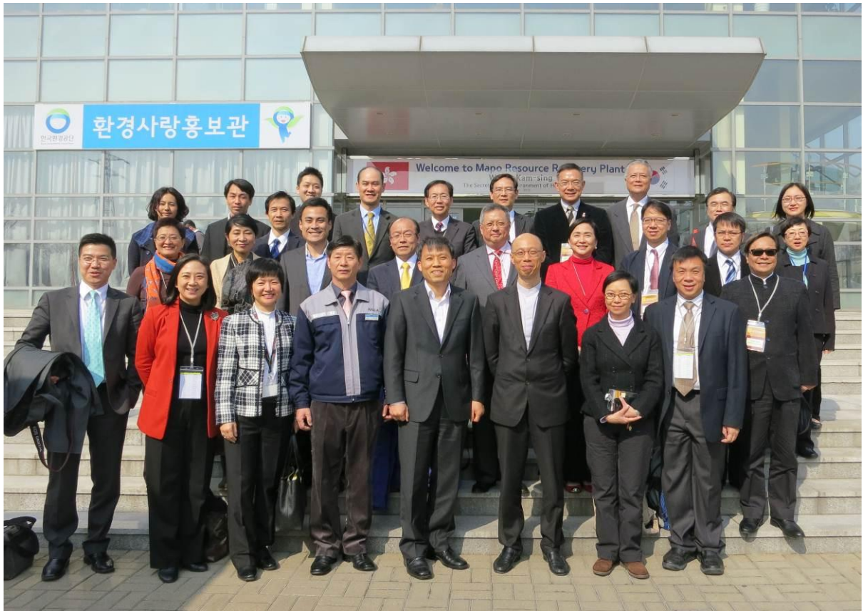
訪問團在麻蒲資源回收廠（焚化爐）合照。