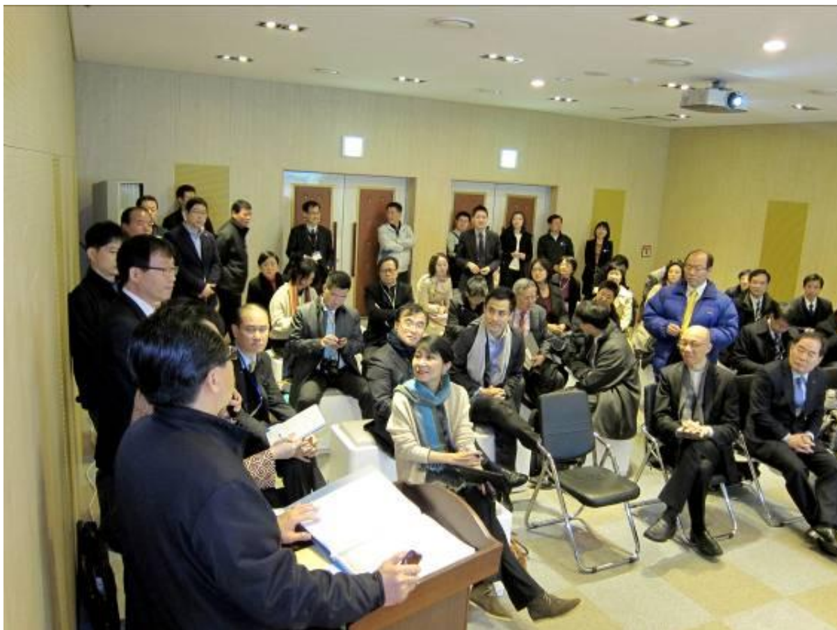
訪問團成員於松坡資源回收中心聽取有關廚餘回收的簡介。