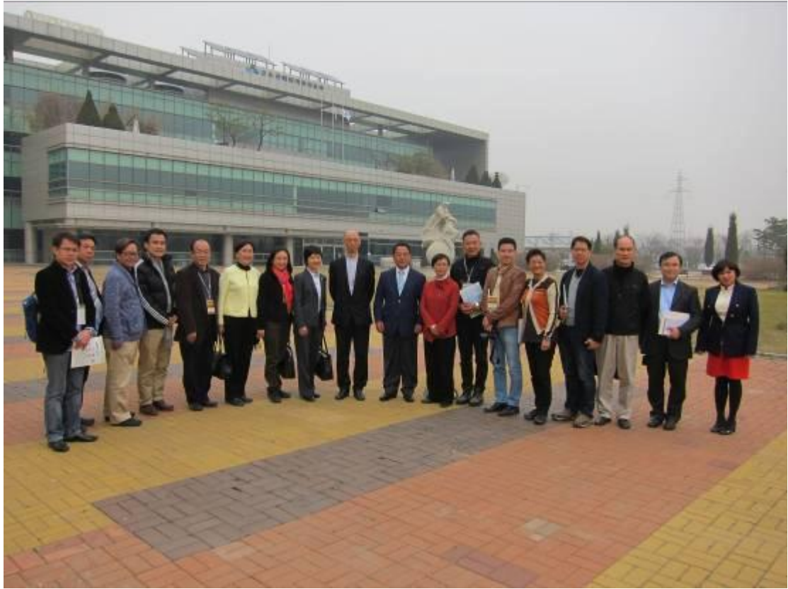
訪問團在首都圈堆填區合照。