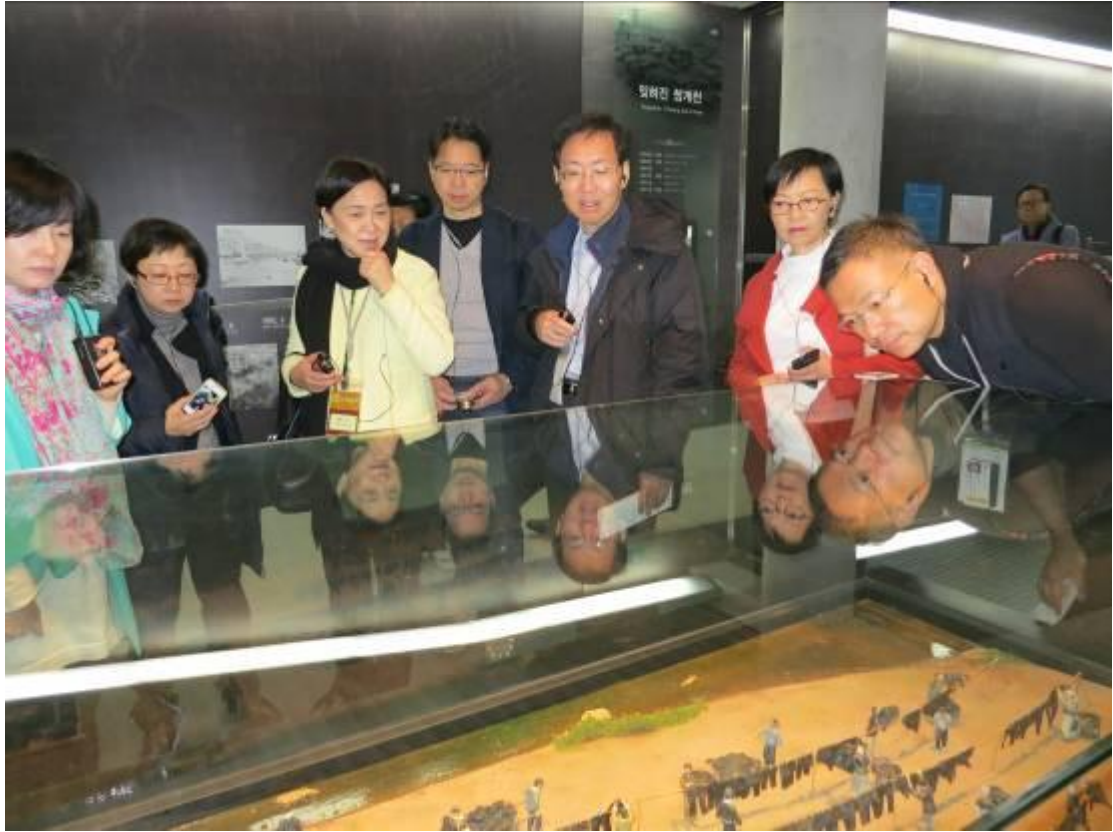
訪問團到訪清溪川文化館。