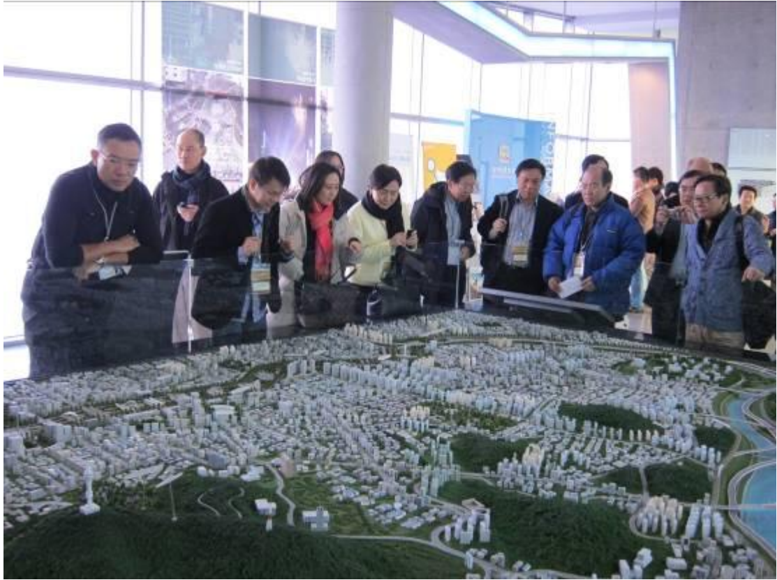
訪問團參觀清溪川復修工程的模型。