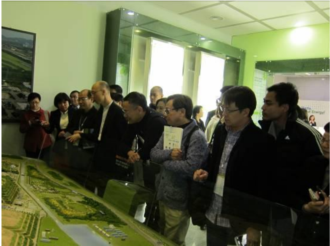
訪問團參觀首都圈堆填區。