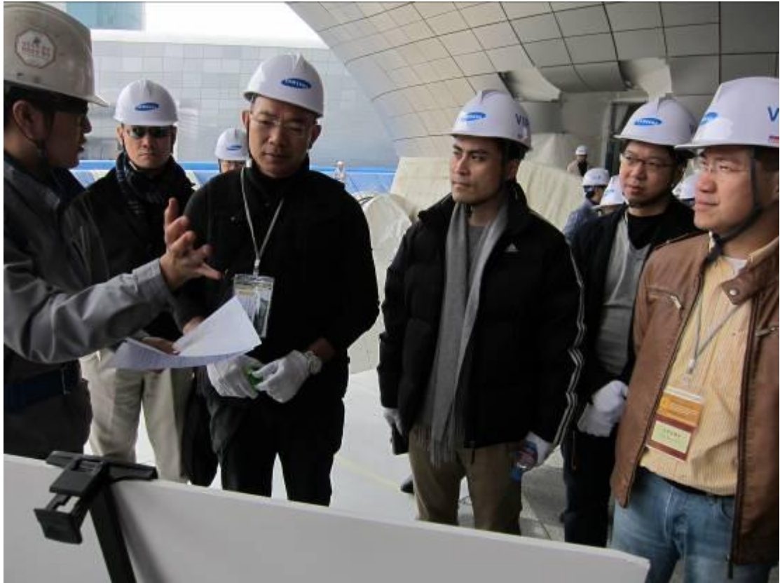
訪問團在 Samsung C&T 進行實地考察。