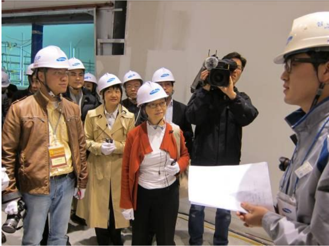
訪問團成員聽取簡介關於 Samsung C&T 的建築廢料管理策略。