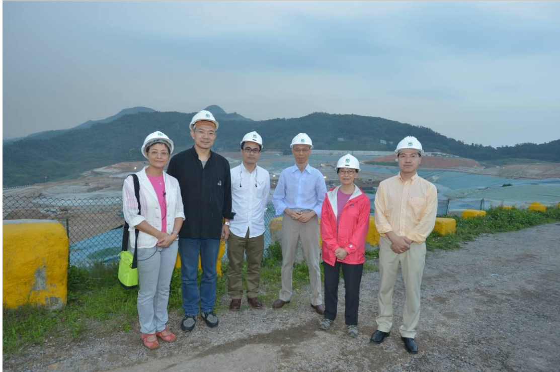
立法會議員與環境局局長視察新界東南堆填區。(左起：黃碧雲議員、謝偉俊議員、郭偉強議員、環境局局長黃錦星、何秀蘭議員以及范國威議員)