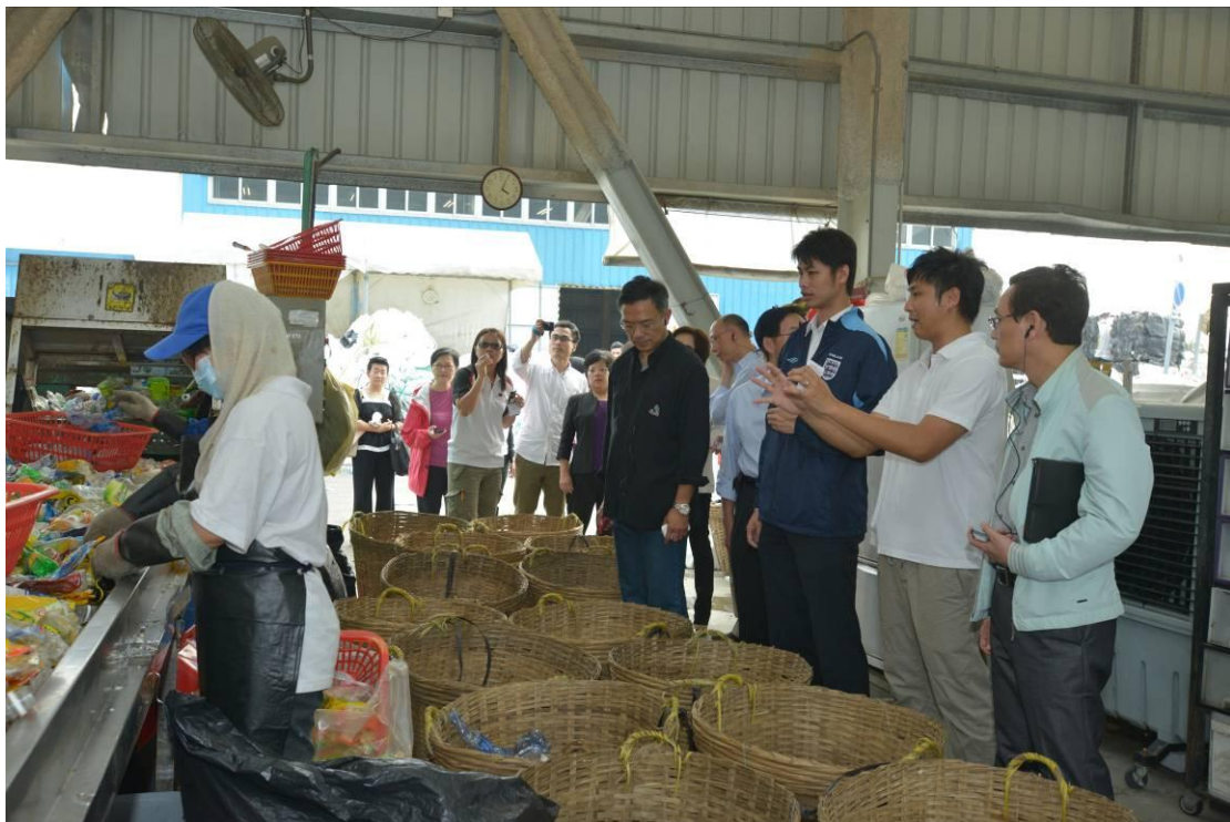
立法會議員參觀環保園內的環保再造廢塑膠廠，聽取簡介其運作情況。