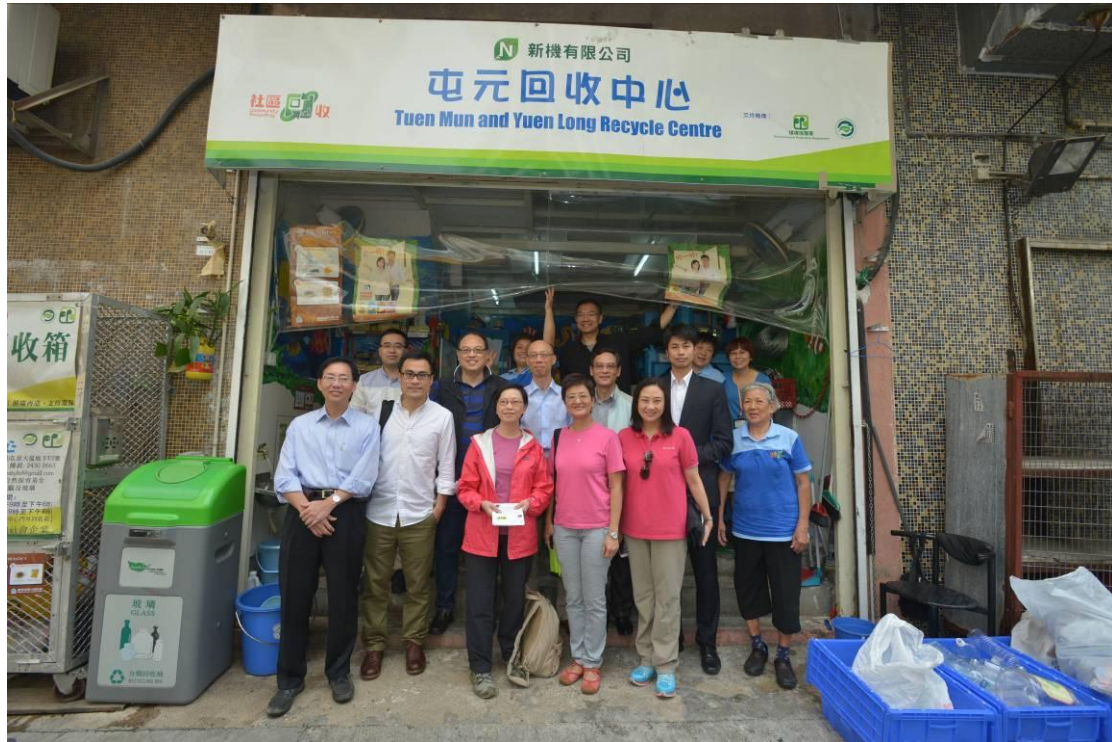
環境事務委員會視察「屯元回收中心」，了解中心回收再造廢塑膠的過程，並與中心工作人員合照。（前排左起：陳健波議員、郭偉強議員、何秀蘭議員（環境事務委員會主席）、黃碧雲議員、葛珮帆議員；第二排右二起：何俊賢議員、謝偉銓議員、環境局局長黃錦星、林大輝議員；後排中間：謝偉俊議員）