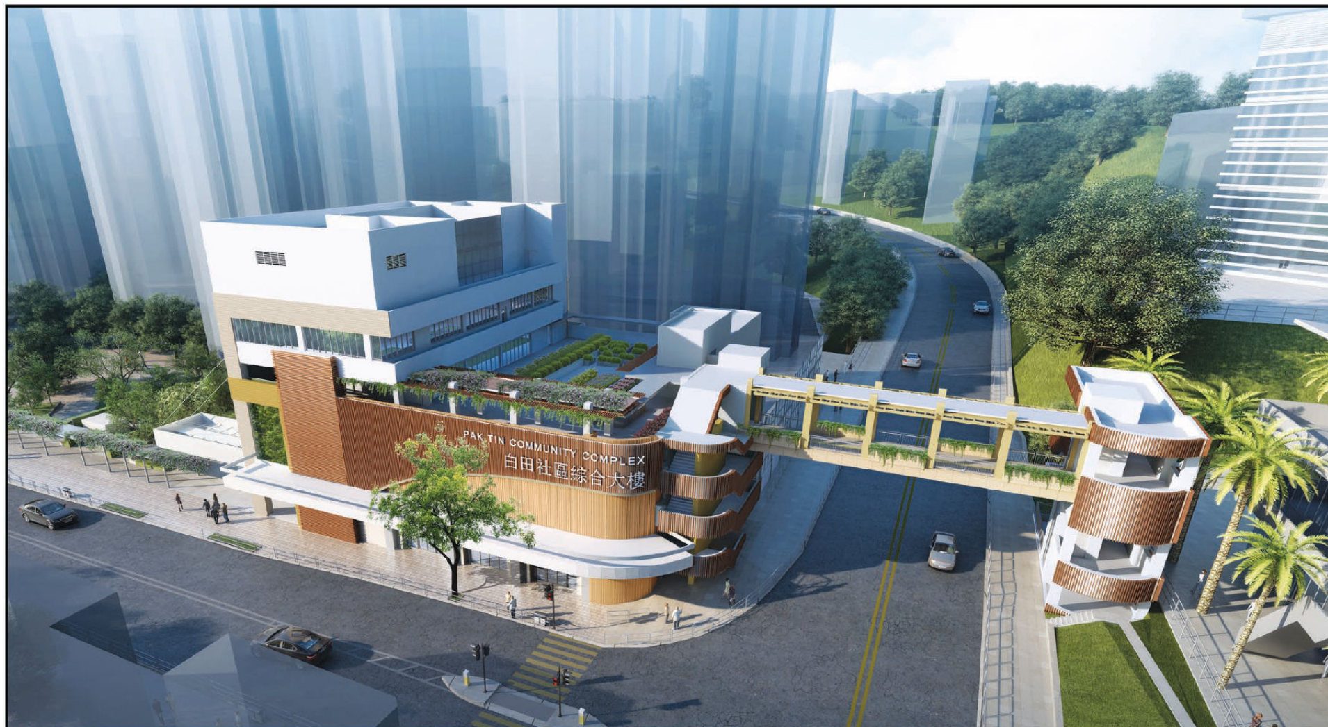
從東南面望向大樓的構思透視圖 Perspective View from South-eastern Direction