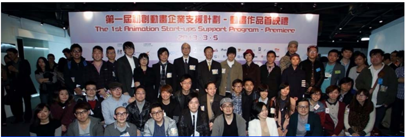
支援新晉動畫及廣告公司