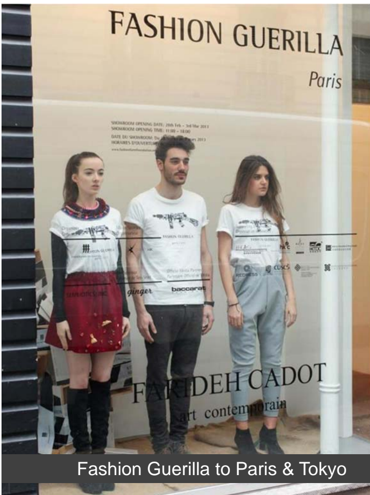
Fashion Guerilla to Paris & Tokyo