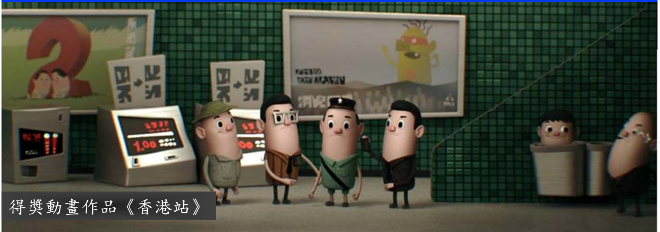
得獎動畫作品《香港站》