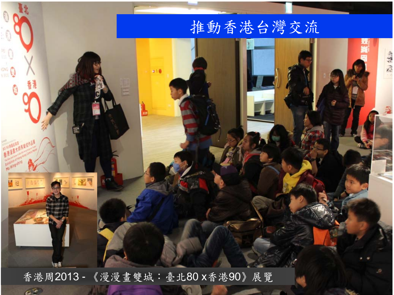
香港周2013 - 《漫漫畫雙城：臺北80 x 香港90》展覽