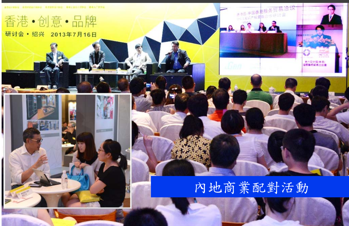
內地商業配對活動