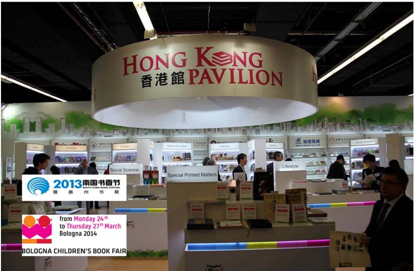
在國際書展設立香港館