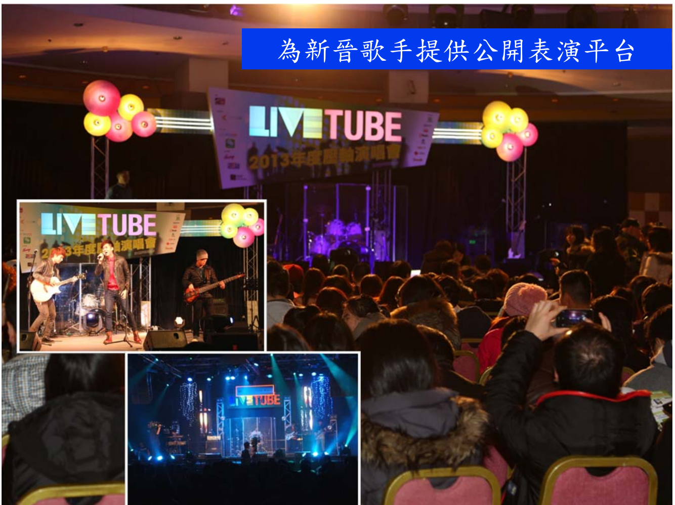
為新晉歌手提供公開表演平台