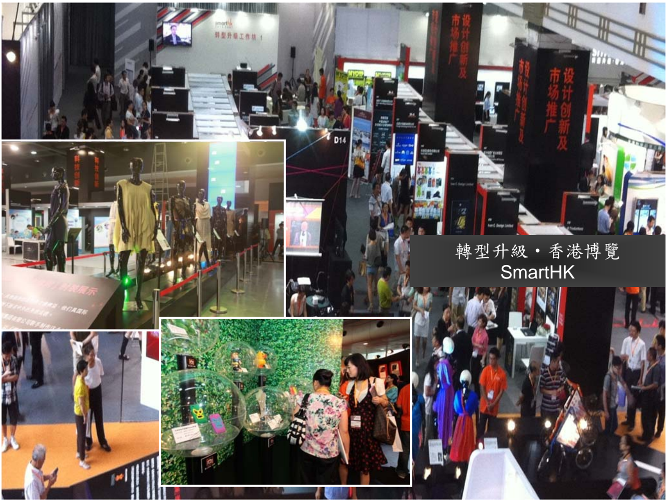
轉型升級·香港博覽 SmartHK