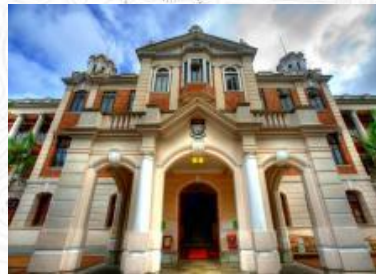
香港大學站 HKU Station