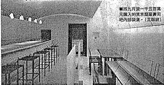
西九斥資一千五百萬元購入的東京藍壽司吧內部裝潢。