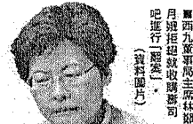
西九董事局主席林鄭月娥拒絕收購壽司吧進行翻新。(資料圖片)

浪費公帑 東方報業集團早前獨家揭爆西九管理局買花一億七千萬元公帑，向瑞士收藏家希克購入一批中國當代藝術品，被本地藝術界質疑並非物有所值。本報近日再發現，西九早前又「扑鐘」斥一千五百萬元「買起」一間遠在日本東京的藍壽司吧的內部裝潢，理由是該壽司吧的招牌傢俬是由名師設計。有藝術界人士質疑西九出價過高，加上過百萬元運輸費，直指西九再次被「搵笨」！有西九董事局成員曾要求為該宗收購「翻案」，但身兼西九董事局主席的政務司司長林鄭月娥卻一直懶理。