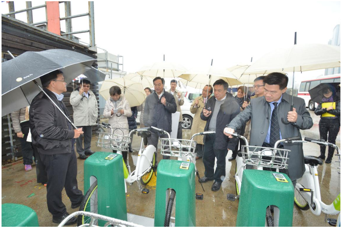
議員了解將於西九文化區內試行的租用單車自動系統。