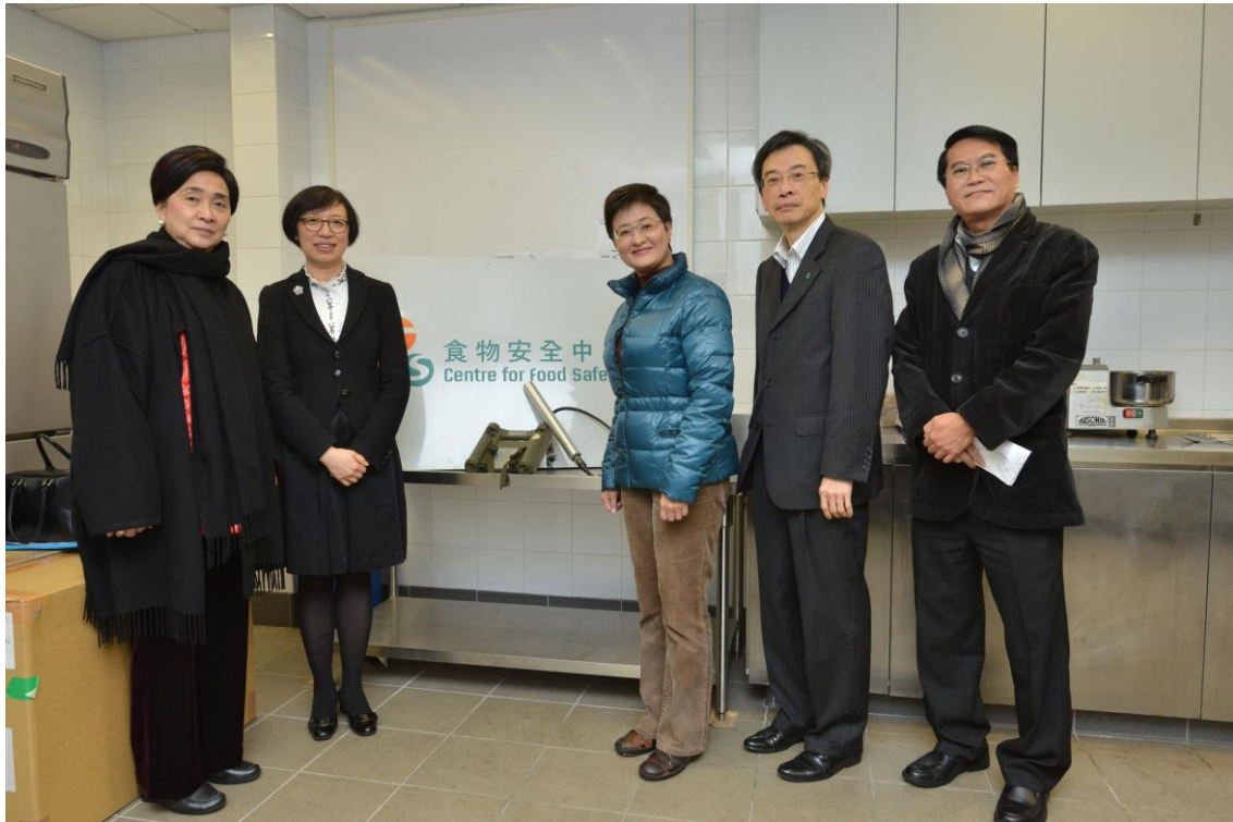
在食物及衛生局副局長陳肇始教授陪同下，立法會議員參觀食物安全中心機場食物檢驗辦事處。（左起：劉慧卿議員、陳肇始教授、黃碧雲議員、李國麟議員及潘兆平議員。）