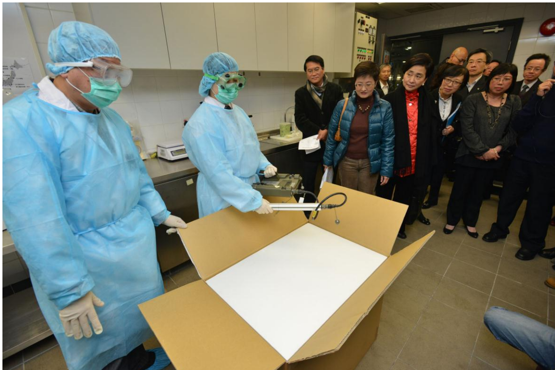
議員觀看食物安全中心人員使用手提輻射探測儀器檢測日本進口食品的示範。