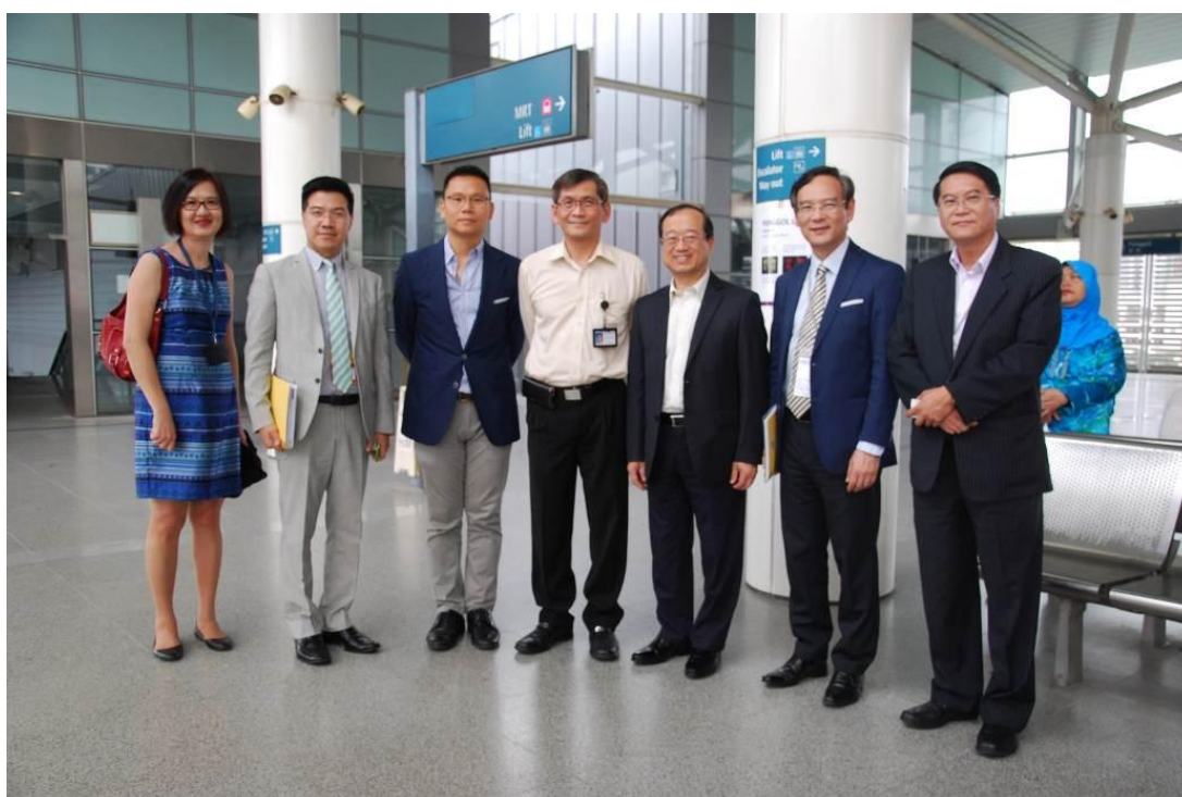
訪問團參觀盛港綜合交通樞紐。