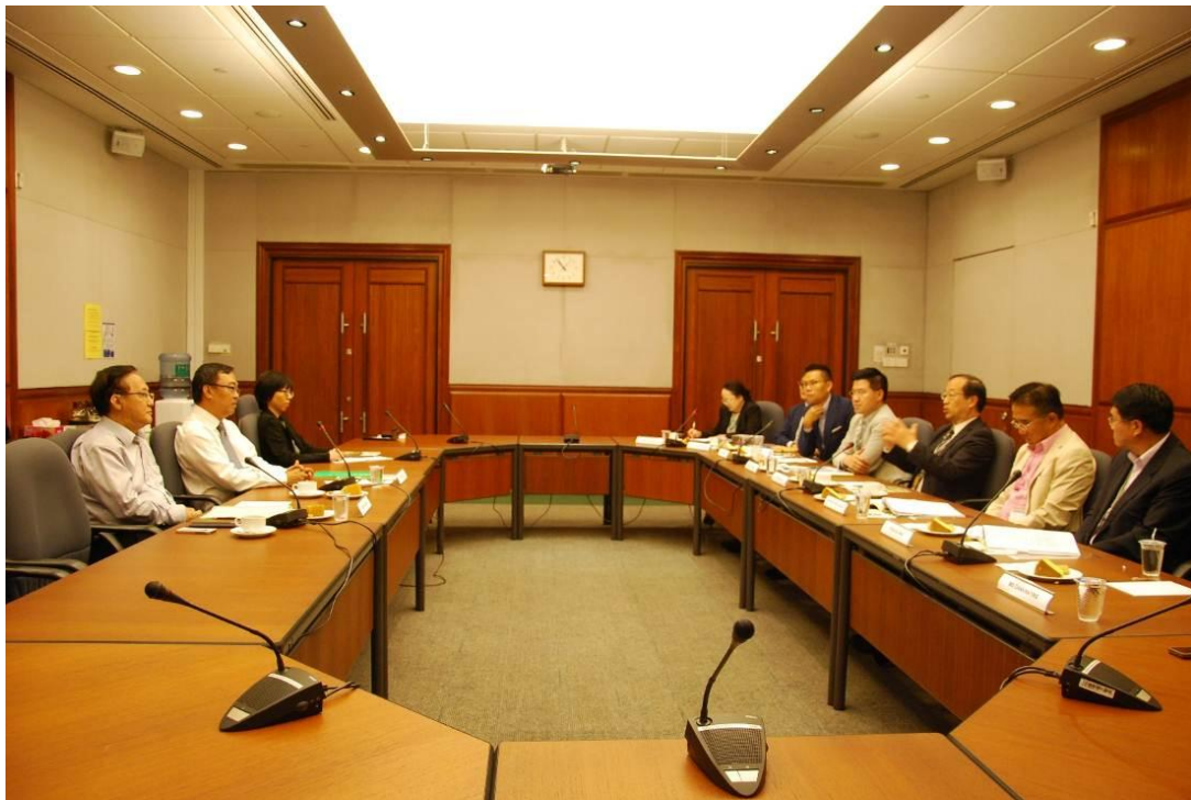
訪問團與政府國會交通委員會正、副主席就交通政策交流意見。