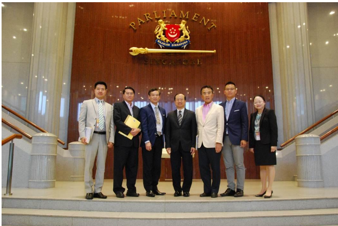
訪問團成員在新加坡國會合照留念。