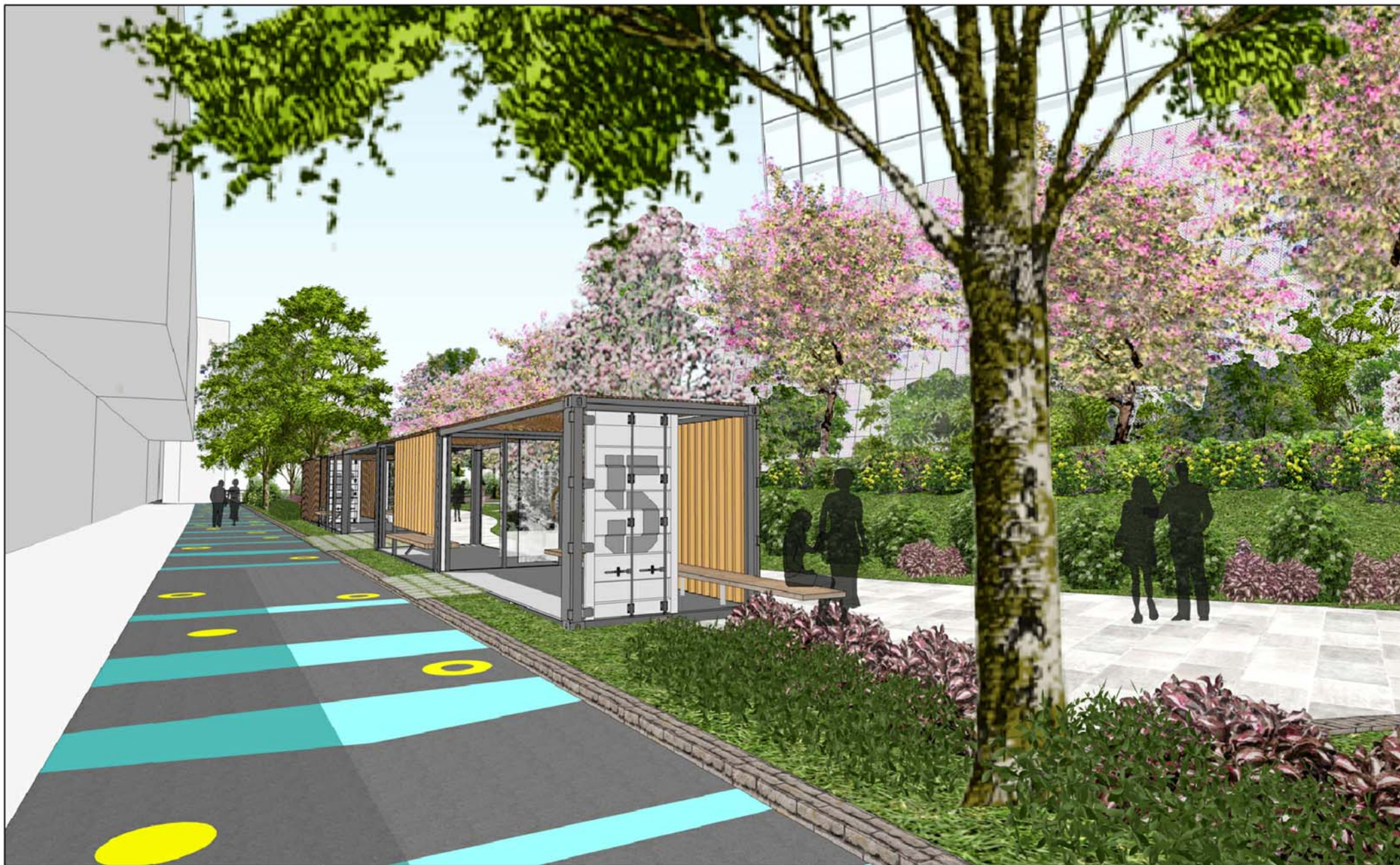
從鄰近街道望向公園的構思圖 VIEW FROM ADJACENT STREET (ARTIST'S IMPRESSION)

PROJECT TITLE 項目名稱 450RO 改建駿業街遊樂場為觀塘工業文化公園 CONVERTING TSUN YIP STREET PLAYGROUND AS KWUN TONG INDUSTRIAL CULTURE PARK